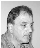
Του ΓΙΩΡΓΟΥ ΣΤΑΥΡΙΑΝΟΥΔΑΚΗ

Όταν το περασμένο καλοκαίρι η διοίκηση του ΣΦΠΧ άρχισε... το χτίσιμο της νέας ομάδας που θα μετείχε στο πρωτάθλημα της Α2 βόλεια ανδρών, στη δεύτερη κατά σειρά ανακοίνωση περιλαμβανόταν ένα όνομα πολύ γνωστό στον χώρο, το οποίο τα τελευταία 20 χρόνια αγωνιζόταν σε ομάδες της Α1 Εθνικής, πανηγυρίζοντας πολλές και σημαντικές διακρίσεις, ενώ υπήρξε μέλος και της εθνικής μας ομάδας.