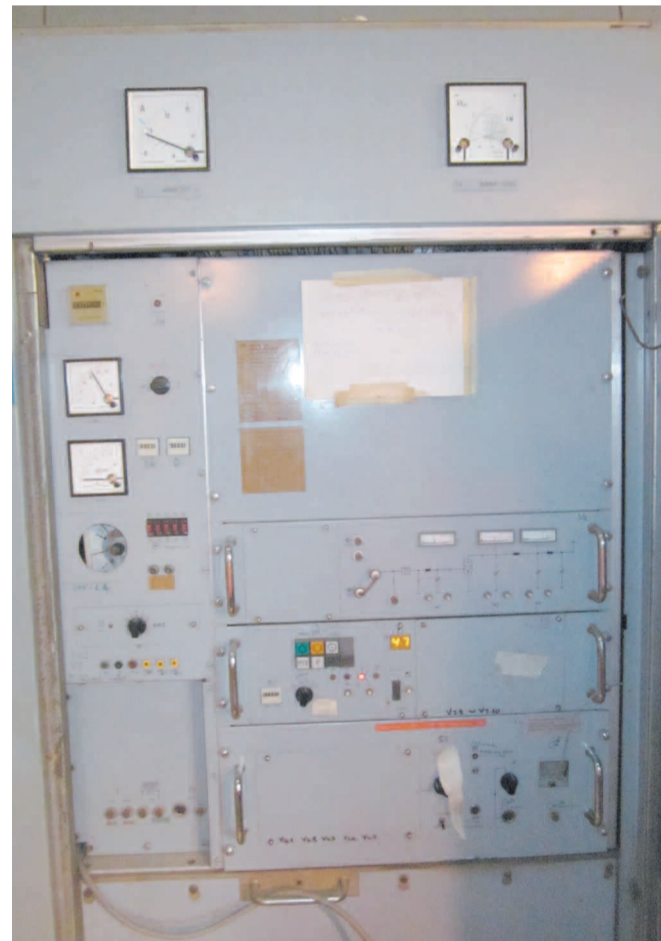
Αποψη του πομπού.

Η κεραία μεσαίων που έχει ύψος πάνω από 100 μέτρα!