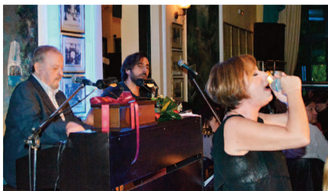
ΕΛ.Φ. Από το ρεσιτάλ που έδωσε ο γνωστός μουσικοσυνθέτης και σκιουργός Γιάννης Σπανός στο ιστορικό καφέ του Δημοτικού Κήπου.