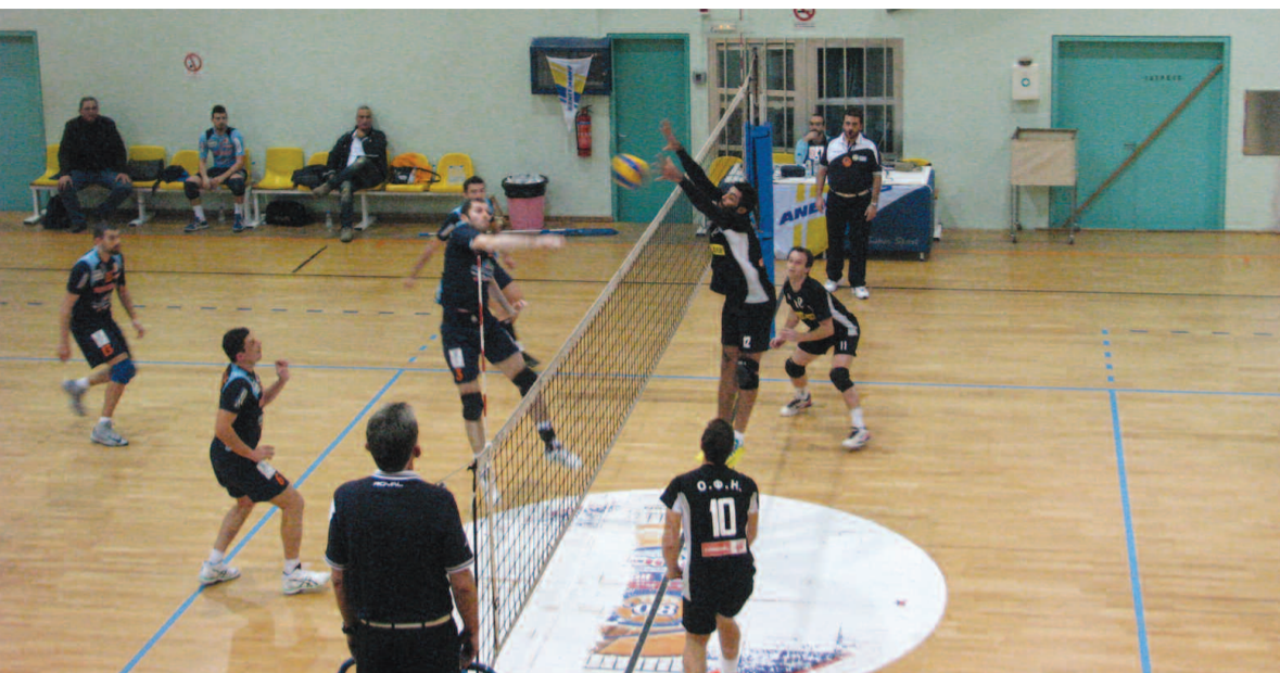
Επιτυχημένη προσπάθεια στο πρόσφατο εντός έδρας παιχνίδι του ΣΦΠΧ με τον ΟΦΗ, για το πρωτάθλημα της Α2 ανδρών