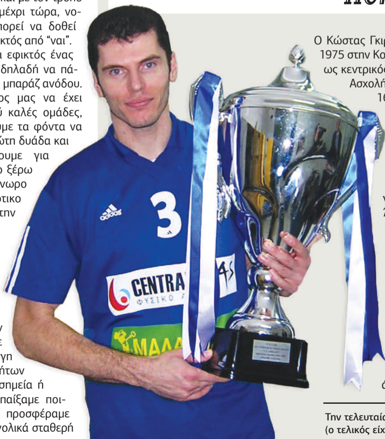
Την τελευταία του χρονιά στον Ηρακλή (2003-4) κατέκτησε ακόμη ένα κύπελλο Ελλάδος (ο τελικός είχε διεξαχθεί στην Ορεστιάδα).

Στα σχεδόν 22 χρόνια που ασχολείται με το βόλεϊ και μάλιστα σε υψηλό επίπεδο, είναι λογικό να έχει ζήσει πολλές καλές στιγμές, από τις οποίες ξεχωρίζει τον πρώτο τίτλο με τον Ηρακλή, ο οποίος κατακτήθηκε στον 5ο τελικό. Σε αυτόν νίκησε 3-2 σερ τον Ολυμπιακό μέσα στη Δραπετσώνα και αναδείχθηκε πρωταθλητής με 3-2 νίκες, με την αποστολή να γνωρίζει αποθεωτική υποδοχή κατά την επιστροφή της, από χιλιάδες οπαδούς του "γηραιού" που είχαν κατακλείσει τις αίθουσες του αεροδρομίου της Θεσσαλονίκης. Είναι παντρεμένος με την Στεφάνια Κορολόγου και έχουν μια κόρη 7 ετών.