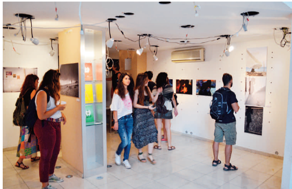
Κλειστά μαγαζιά επί της οδού Ποτιέ “ζωντανεύουν” ξανά καθώς μετατράπηκαν σε χώρους τέχνης για να φιλοξενήσουν την έκθεση φωτογραφίας της φωτογραφικής ομάδας του Πολυτεχνείου “Φωτοσκίαση”.

Κι αν η ιδιαιτερότητα του χώρου έκρυβε ίσως κάποιες δυσκολίες στην οργάνωση της έκθεσης, το γεγονός ότι συμμετέχουν σε αυτήν 37 καλλιτέχνες αποτέλεσε μια ακόμα σημαντική πρόκληση όπως επεσήμανε ο κ. Φίσερ: «Είναι πολύ ετερόκλητο το υλικό αλλά νομίζω ότι σε πολλές περιπτώσεις καταφέραμε να παντρέψουμε πράγματα που ίσως με μια πρώτη ματιά δεν ταιριάζουν αλλά όμως τελικά έχουν κάτι κοινό. Μην ξεχνάμε ότι είναι μια έκθεση με 37 καλλιτέχνες που σημαίνει 37 διαφορετικές ματιές. Εγώ πάντως ως επιμε-