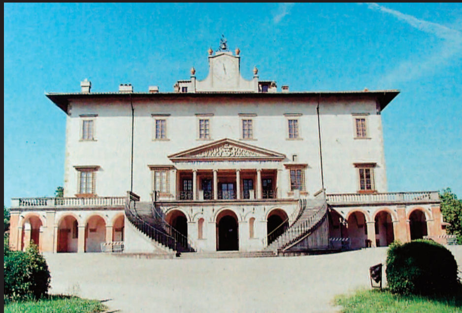
Giuliano da Sangallo (Τζουλιάνο ντα Σανγκάλλο), "Villa Medici", 1480, Poggio a Caiano.