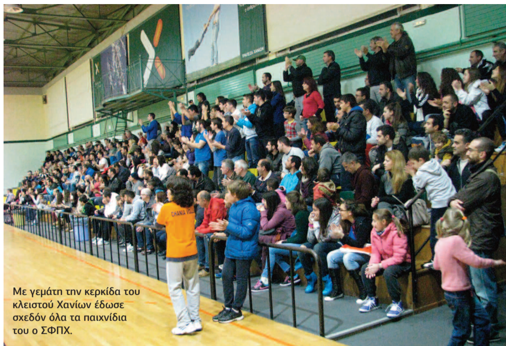
Με γεμάτη την κερκίδα του κλειστού Χανίων έδωσε σχεδόν όλα τα παιχνίδια του ο ΣΦΠΧ.

Όμως ΣΦΠΧ δεν είναι μόνο το ανδρικό τμήμα, υπάρχουν οι παίδες και οι έφηβοι, παιδιά που αποκόμισαν φέτος υπερπολύτιμες εμπειρίες κάνοντας προπόνηση με τη μεγάλη ομάδα. Το γεγονός αυτό έχει συμβάλει στο να έχουν ήδη αλλάξει τρόπο αντιμετώπισης της προπόνησης και της επαφής τους