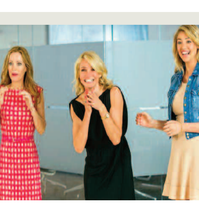
Η ΑΛΛΗ ΓΥΝΑΙΚΑ