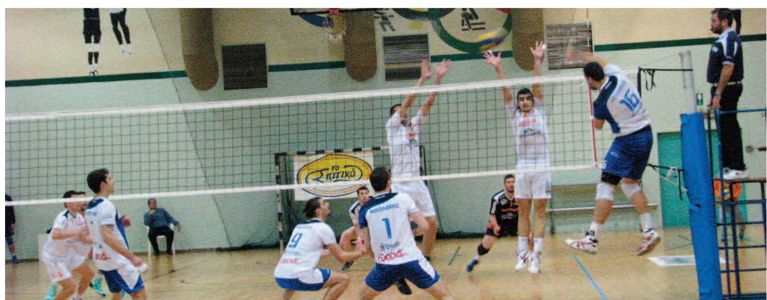
Στιγμιότυπο από τον αγώνα κυπέλλου με την Κηφισιά