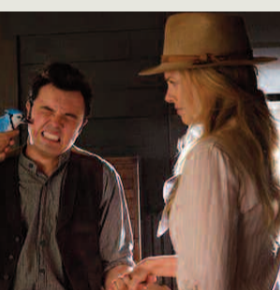
ΧΙΛΙΟΙ ΤΡΟΠΟΙ ΝΑ ΠΕΘΑΝΕΙΣ ΣΤΗΝ ΑΓΡΙΑ ΔΥΣΗ