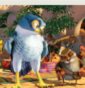
ΖΑΜΠΙΖΙΑ: ΠΟΥΛΙΑ ΣΤΟΝ ΑΕΡΑ