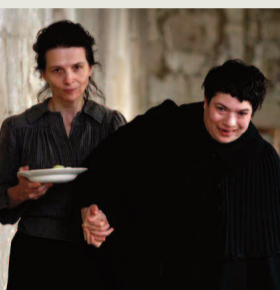
"ΚΑΜΙΑ ΚΛΟΝΤΕΛ 1915"