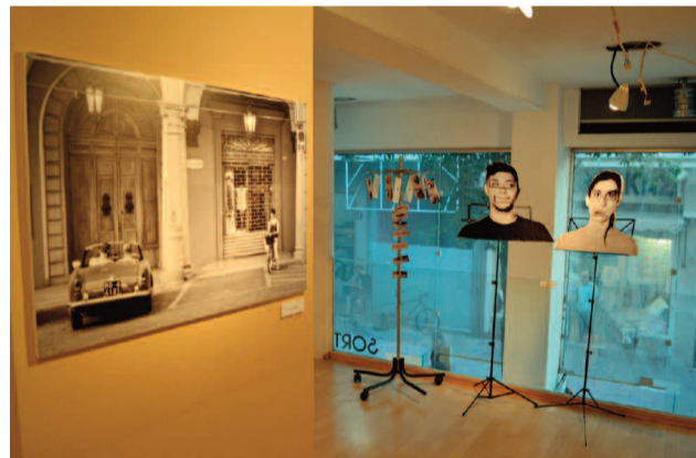
Τα σημάδια από την εμπορική δραστηριότητα που υπήρχε μέσα στα καταστήματα παραμένουν εμφανή πλαισιώνοντας τα έργα φωτογραφίας.

λητής βρήκα το υλικό έτοιμο, απέκλεισα πολύ λίγες φωτο-