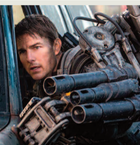
ΣΤΑ ΟΡΙΑ ΤΟΥ ΑΥΡΙΟ