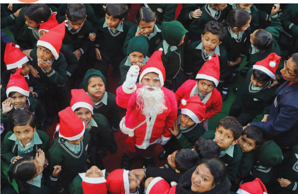
❖ Ινδία: Μικροί Άν Βασίλδες σε σχολική γιορτή στην πόλη Μποπάλ.

Ο φωτογραφικός φακός διεθνών ειδησιογραφικών πρακτορείων καταγράφει τα στιγμιότυπα και μας μεταφέρει εικόνες από τα Χριστούγεννα στον κόσμο.