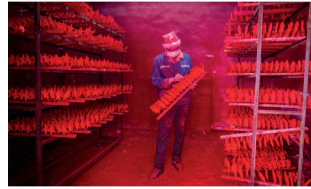
Οι δυο άντρες παράγουν περίπου 5.000 κόκκινες νιφάδες χιονιού ημερησίως και ο μισθός τους ξεπερνά ελάχιστα τα 300 ευρώ το μήνα.

Το συγκρότημα ανακρήχθηκε από τον ΟΗΕ, ως «η μεγαλύτερη