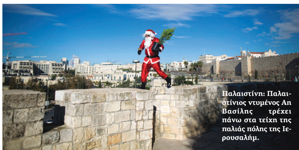
Παλαιστίνη: Παλαιστίνιος ντυμένος Άν Βασίλης τρέχει πάνω στα τείχη της παλιάς πόλης της Ιερουσαλήμ.