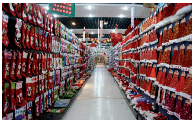
Εκθεση με αγιοβασιλιάτικα καπέλα... Μέσα σε κάποιο από τα showrooms της Υίγου.

νιφάδες χιονιού, παίρνουν τη θέση τους δίπλα σε άλλα εορταστικά παραφερνάλια στο διεθνές εμπορικό κέντρο της Υίγου. Είναι ένας καταναλωτικός παράδεισος γεμάτος με αντικείμενα που καθόλου δεν χρειαζόμαστε, αλλά που σε κάποια εορταστική παρόρμηση νιώθουμε την καταναγκαστική υποχρέωση να αγοράσουμε. Υπάρχουν ολόκληρες "οδοί" στον εορταστικό λαβύρινθο αυτού του εμπορικού κέντρου που είναι αφιερωμένες σε διάφορα "θεματικά" στολιδιά: ψεύτικα λουλούδια, φουσκωτά παιχνίδια, ομπρέλες, άνορακ, πλαστικοί κουβάδες και ρολόγια.