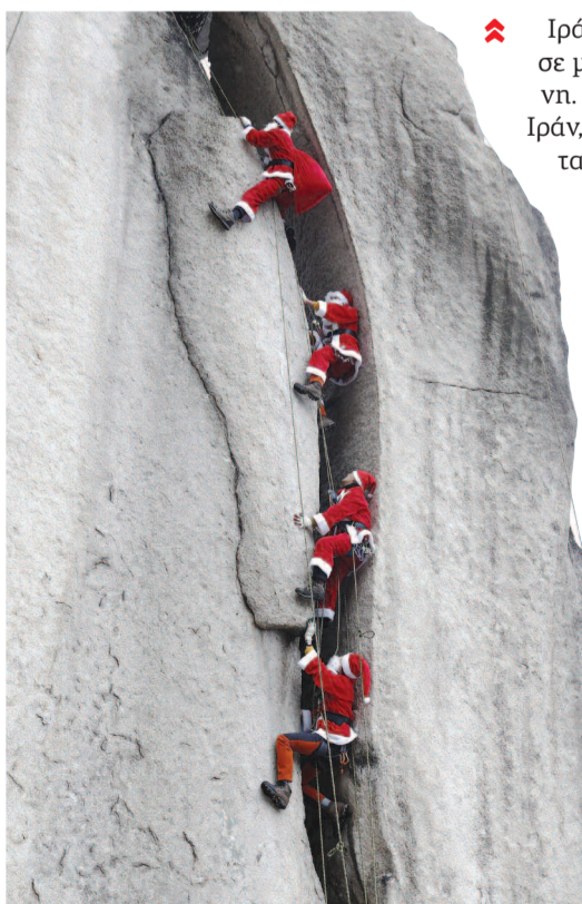
❖ Νότια Κορέα: Τολμηροί ορειβάτες με στολή Άν Βασίλη σκαρφαλώνουν στο βουνό Buckhan, κοντά στη Σεούλ, στο πλαίσιο χριστουγεννιάτικης εκδήλωσης.