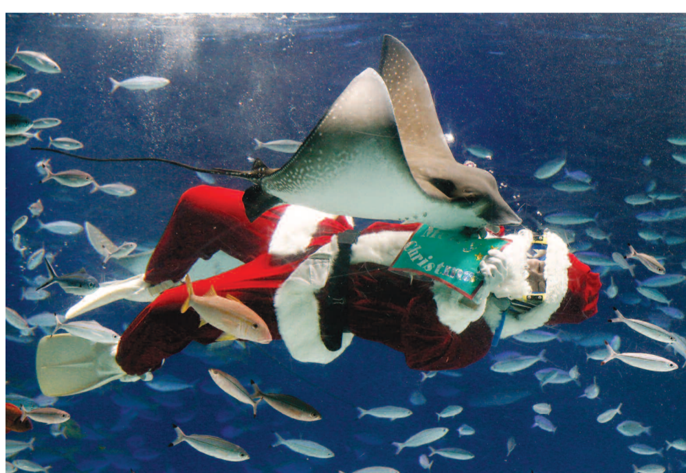
❖ Ιαπωνία: Ο... υποβρύχιος Άν Βασίλης σε στενές επαφές με τα ψάρια του Ενυδρείου "Sunshine" στο Τόκιο.