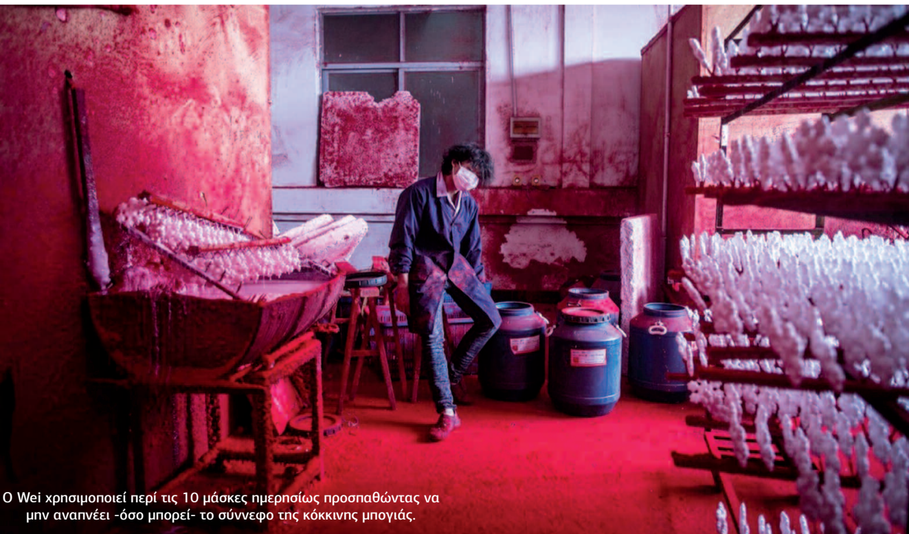
Ο Wei χρησιμοποιεί περί τις 10 μάσκες ημερησίως προσπαθώντας να μην αναπνέει -όσο μπορεί- το σύννεφο της κόκκινης μογιότις.