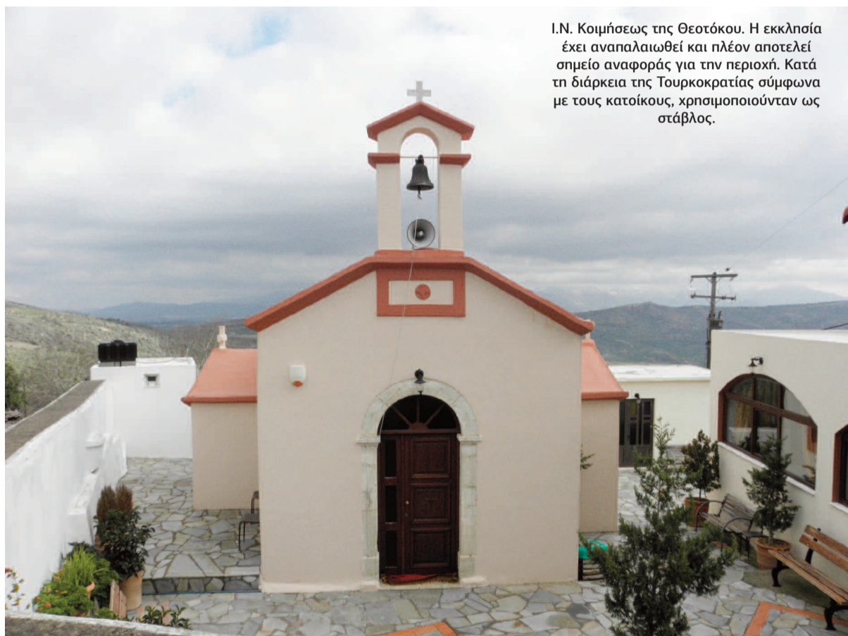
Ι.Ν. Κοιμήσεως της Θεοτόκου. Η εκκλησία έχει αναπαλαιωθεί και πλέον αποτελεί σημείο αναφοράς για την περιοχή. Κατά τη διάρκεια της Τουρκοκρατίας σύμφωνα με τους κατοίκους, χρησιμοποιούνταν ως στάβλος.

Τον ρώτησα για τους γονείς του. Πως βρέθηκαν στο Ηράκλειο από την Μικρά Ασία; Στις απαντήσεις του μαθαίνει κανείς τις δυσκολίες που πέρασαν όλοι οι Μικρασιάτες μέχρι να