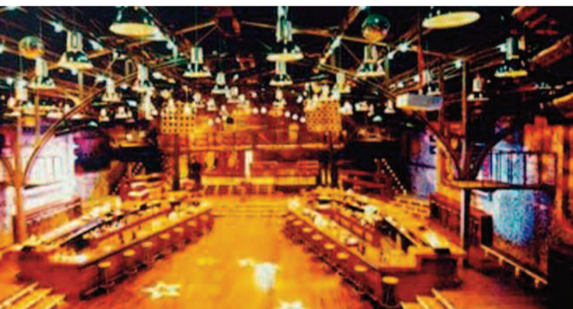
Στιγμιότυπο από το Στάδιο club (πρώην disco Portocali), (1998).