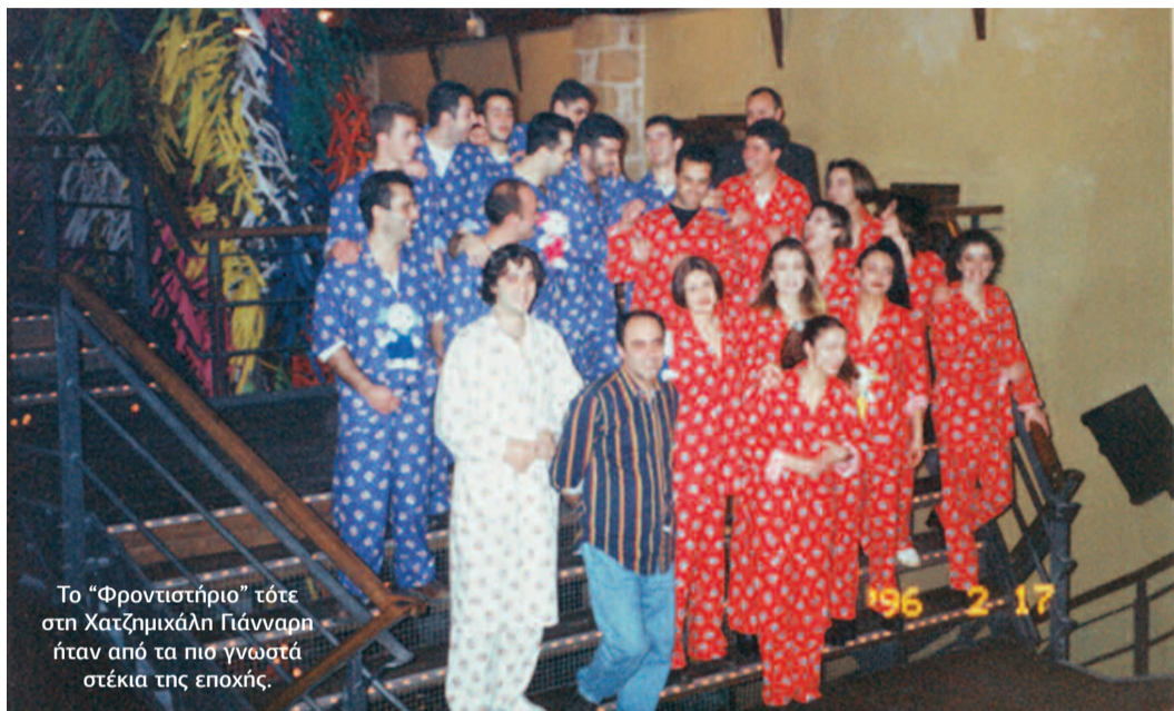
Το "Φροντιστήριο" τότε στη Χατζημιχάλη Γιάνναρη ήταν από τα πιο γνωστά στέκια της εποχής.

Τ ι έχει μείνει από τη δεκαετία του '90 στον χώρο της νύχτας στα Χανιά; Τα πρώτα πολύ μεγάλα club που διαδέχθηκαν τις disco, τα καλοφτιαγμένα μπαρ, η διάθεση του κόσμου τότε να χορεύει, να διασκεδάσει, η "εισβολή" της ελληνικής μουσικής στις πίστες; Αυτά και ακόμα περισσότερα κουβεντιάζουμε με... νοσταλγική -είναι αλήθεια- διάθεση με επαγγελματίες και μουσικούς παραγωγούς της εποχής. Γιατί κάθε δεκαετία έχει τους δικούς της κανόνες, τη δική της μουσική, τα δικά της στέκια.