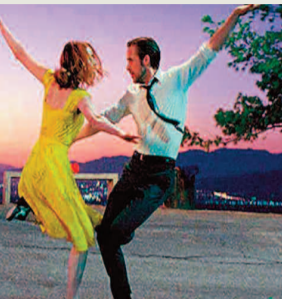
“LA LA LAND”