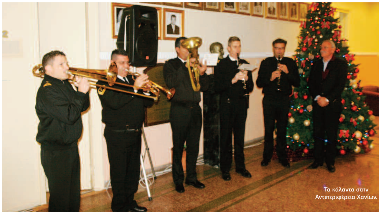
Τα κάλαντα στην Αντιπεριφέρεια Χανίων.

ΣΗΜ.: Ο ΚΙΝΗΜΑΤΟΓΡΑΦΟΣ ΜΑΣ ΘΑ ΠΑΡΑΜΕΙΝΕΙ ΚΛΕΙΣΤΟΣ ΤΗΝ ΠΑΡΑΜΟΝΗ ΤΗΣ ΠΡΩΤΟΧΡΟΝΙΑΣ.