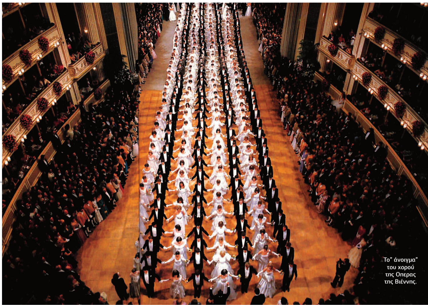
Το "άνοιγμα" του χορού της Όπερας της Βιέννης.

Το «Κάιζερμαλλ», το οποίο γίνεται στις αίθουσες του παλατιού των Αψβούργων το βράδυ της 31ης Δεκεμβρίου, τον χορό της Φι-