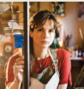
“Η ΡΟΖΑ ΤΗΣ ΣΜΥΡΝΗΣ”