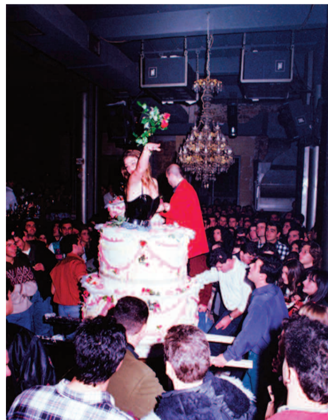
Για τη δεκαετία του '90 η "Αναγέννηση" ήταν το μεγαλύτερο club της εποχής.

«Ο κόσμος έβγαине, δεν υπήρχαν εφορίες, ό,τι έβγαζες το έπαιρνες, το έτρωγες. Ο κόσμος έδινε χρήματα. Αν υπήρχε κέφι και αν