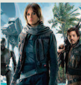
“ROGUE ONE: A STAR WARS STORY”