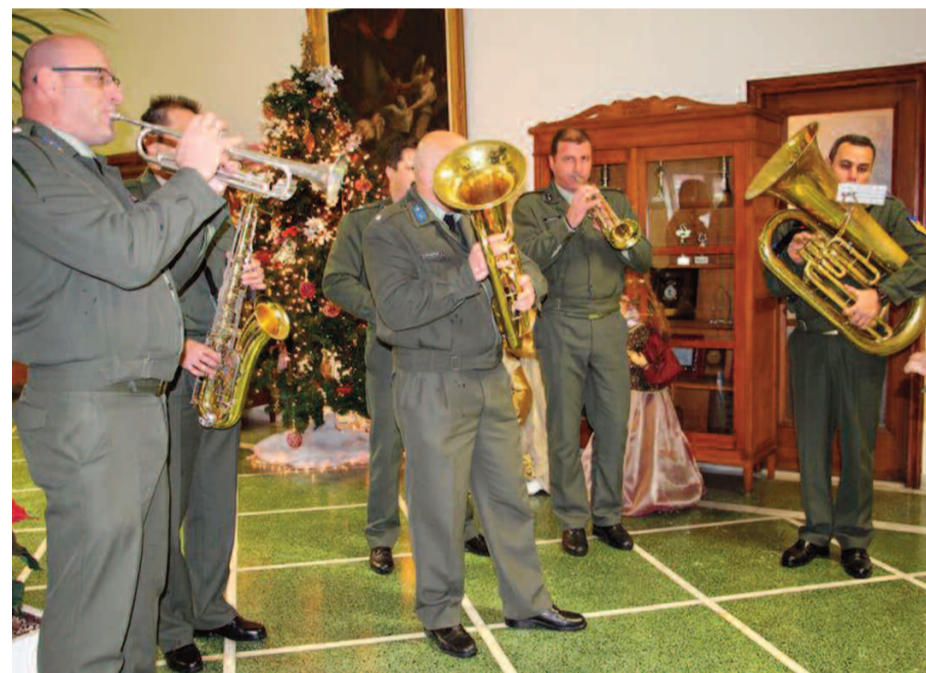
Τα πρωτοχρονιάτικα κάλαντα στον Δήμο Χανίων.

Ο κ. Βουλγαράκης αντάλλαξε ευχές με τους μουσικούς για μια καλύτερη νέα χρονιά και τους ευχαρίστησε θερμά που και φέτος συνέβαλαν ουσιαστικά στο εορταστικό κλίμα των ημερών. Τα πρωτοχρονιάτικα κάλαντα έψαλλαν χθες στον δήμαρχο Χανίων, Τάσο Βάμβουκα, στους αντιδημάρχους και τους υπαλλήλους του Δήμου η Φιλαρμονική του Δήμου Χανίων και τμήματα των Ενόπλων Δυνάμεων. Ο δήμαρχος Χανίων προσέφερε παραδοσιακό κέρασμα και ευχήθηκε σε όλους «Χρόνια Πολλά με υγεία και ειρήνη, προσωπική και οικογενειακή ευτυχία».