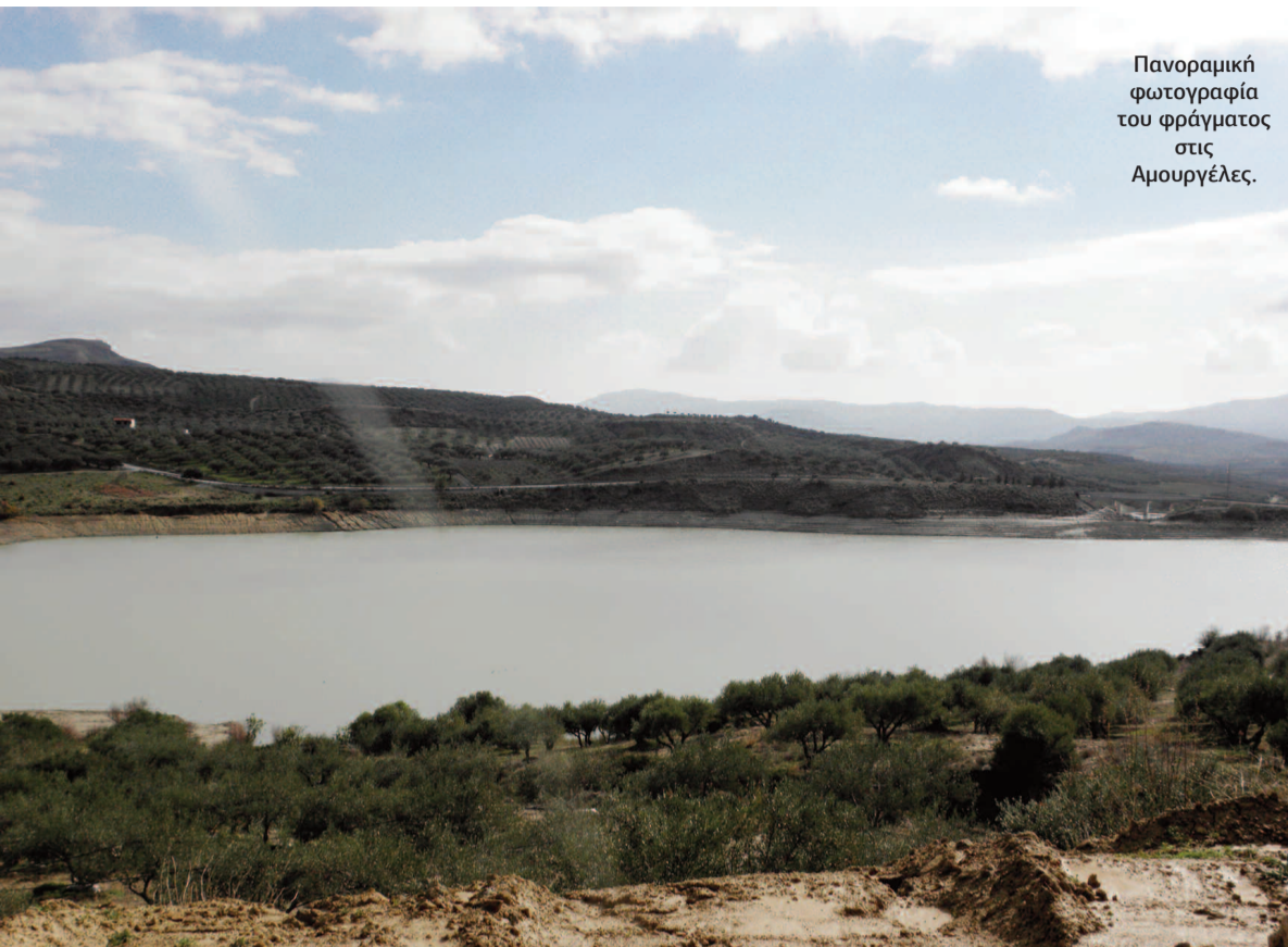
Πανοραμική φωτογραφία του φράγματος στις Αμουργέλες.

“Δεν φύγουν θα τους σκοτώσουν.” Τον ρωτήσαμε για την μητέρα του και μας απάντησε πως “Η μάνα μου ήταν ξαναπαντρεμένη στο Λυθρί. Με την Καταστροφή ξεκίνησε με δύο μωρά και ένα μπόγο με ρούχα να έρθει στην Ελλάδα γιατί τον πρώτο της άντρα τον είκανε σκοτώσει οι Τούρκοι. Τελικά έφτασε στο Ηράκλειο μόνο με τον μπόγο... Εδώ μετά από καιρό γνώρισε τον πατέρα μου και έφτιαξαν την δική τους οικογένεια. Βρέθηκαν στο Πανόραμα γιατί εκεί τους έτυχε ο κλήρος που έδινε το κράτος.”