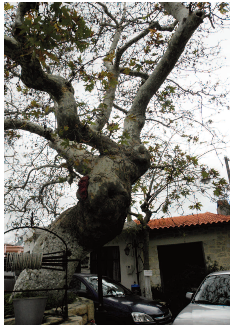
Ο πλάτανος στον οποίο σύμφωνα με τους κατοίκους η μητέρα του μικρού Τουρκοκρητικού έδεσε τα μαλλιά της.

Σύμφωνα λοιπόν με όσα μας μετέφεραν κάτοικοι “Όταν ήρθε η ώρα της ανταλλαγής των πληθυσμών ένα 10χρονο παιδί από οικογένεια Μουσουλμάνων αρνήθηκε να ακολουθήσει τους δικούς του. Μία μέρα πριν η οικογένεια φύγει από το χωριό εκείνο έφυγε πρώτο πήγε σε διπλανό χωριό και κρύφτηκε σε ένα κελάρι σπιτιού Χριστιανικής οικογένειας. Μετά από άκαρπες αναζητήσεις η πραγματική του οικογένεια έφυγε ενώ οι Χριστιανοί είχαν βρει και είχαν φιλοξενήσει σπίτι τους το μικρό παιδί. Με το πέρασμα των χρόνων η πραγματική οικογένεια του μικρού έμαθε ότι το παιδί της ζει στην Κρήτη και η μάνα γύρισε να το πάρει. Όμως εκείνο αρνήθηκε και ζήτησε να μείνει στην δεύτερη του οικογένεια ενώ τους είπε ότι πλέον είναι Χριστιανός. Η μάνα του, απογοητευμένη έκοψε μια τούφα από τα μαλλιά της και τα κρέμασε στον Πλάτανο του χωριού δίνοντας την κατάρα της στην “δεύτερη” οικογένεια του γιου της λέγοντας «Εύχομαι όσες τρίχες μείνουν στον κορμό του πλατάνου τόσα παιδιά να κάνετε και να τα χάσετε». Σύμφωνα με την ιστορία, η Χριστιανή μάνα μετά από χρόνια έκανε τρία αγόρια τα οποία σκοτώθηκαν κατά την διάρκεια του Β΄ Παγκοσμίου Πολέμου.