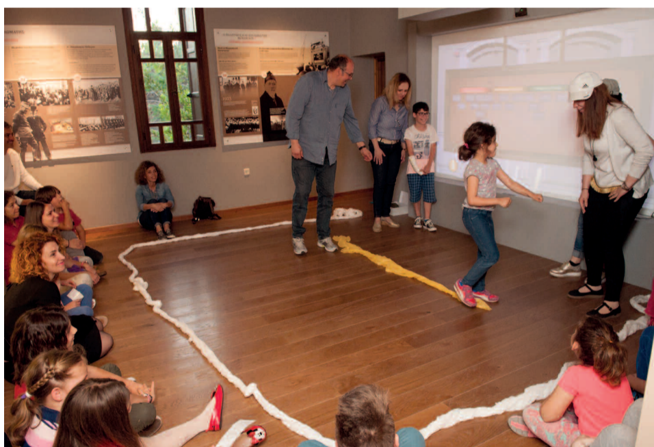
Οικογενειακό πρόγραμμα στο Μουσείο Ελευθερίου Βενιζέλου.

Σήμερα ένα μουσείο που επιθυμεί να ανταποκριθεί στην κοινωνική του αποστολή πρέ-