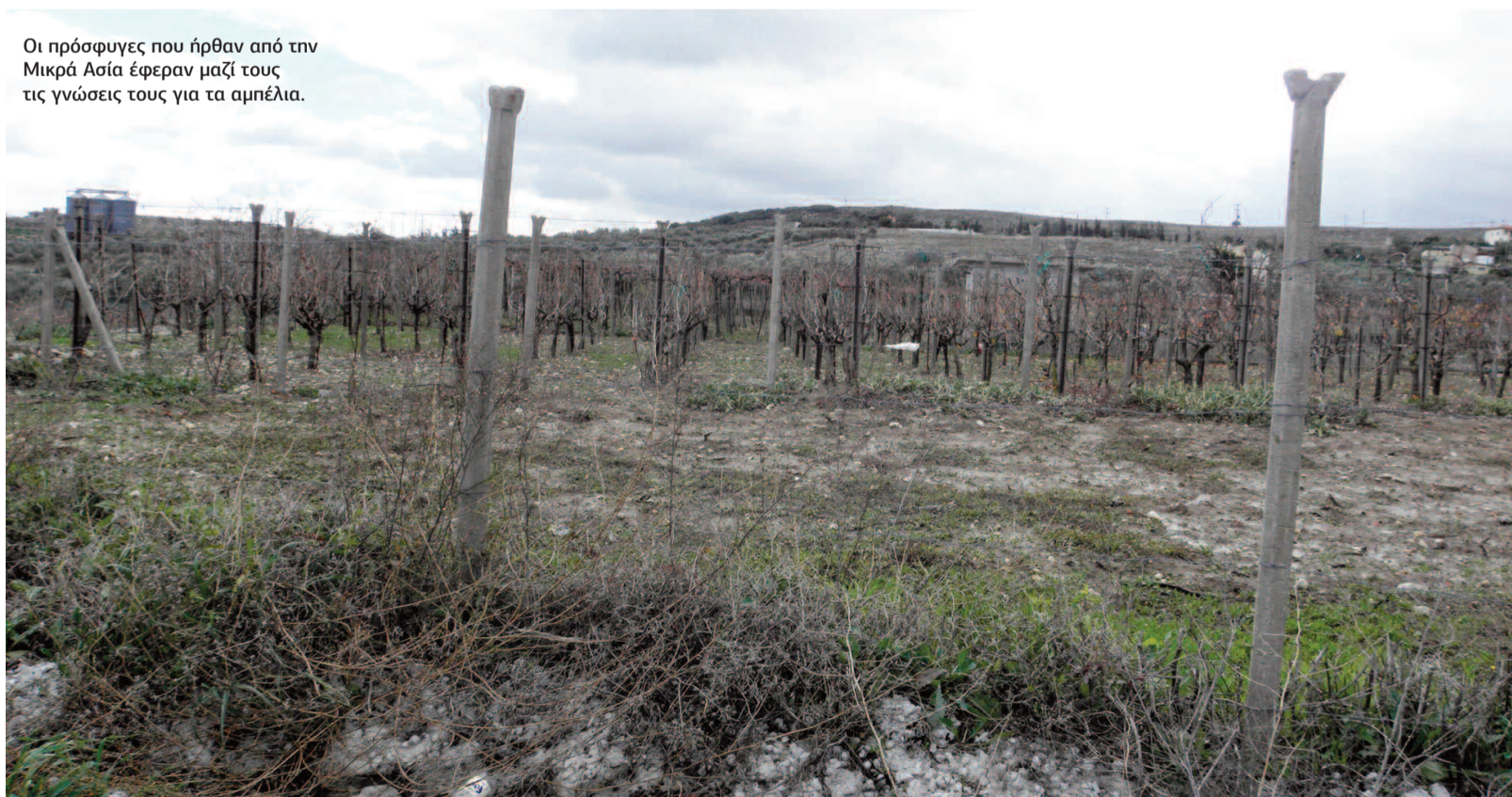
Οι πρόσφυγες που ήρθαν από την Μικρά Ασία έφεραν μαζί τους τις γνώσεις τους για τα αμπέλια.

στο Ηράκλειο έμενε μαζί με τους άλλους πρόσφυγες στο τότε κτήριο της Νομαρχίας. Οι περισσότεροι Κρητικοί τους καλοδέχτηκαν τους πρόσφυγες εδώ στο Ηράκλειο. Μα ήταν και κάμποιοι που πηγαίαν την νύχτα στη Νομαρχία και τους απειλούσαν ότι αν