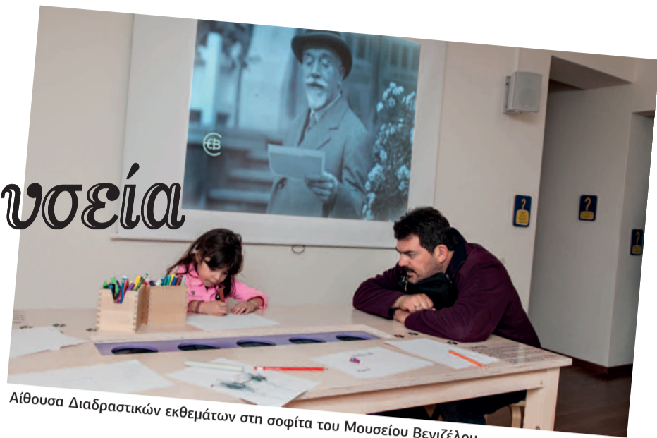
Αίθουσα Διαδραστικών εκθεμάτων στη σοφίτα του Μουσείου Βενιζέλου.