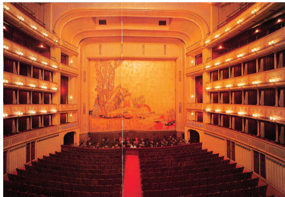
Το αμφιθέατρο της Όπερας της Βιέννης

Αν κάποιος θέλουν να προλάβουν τον χορό της Όπερας μπορούν να κλείσουν εισιτήρια στον αριθμό 0043-1-514-44-2624. Ίσως σταθούν τυχεροί να πουν την μαγική φράση σε μια αιθέρια Βιεννέζα: «Tanzen wir?»!