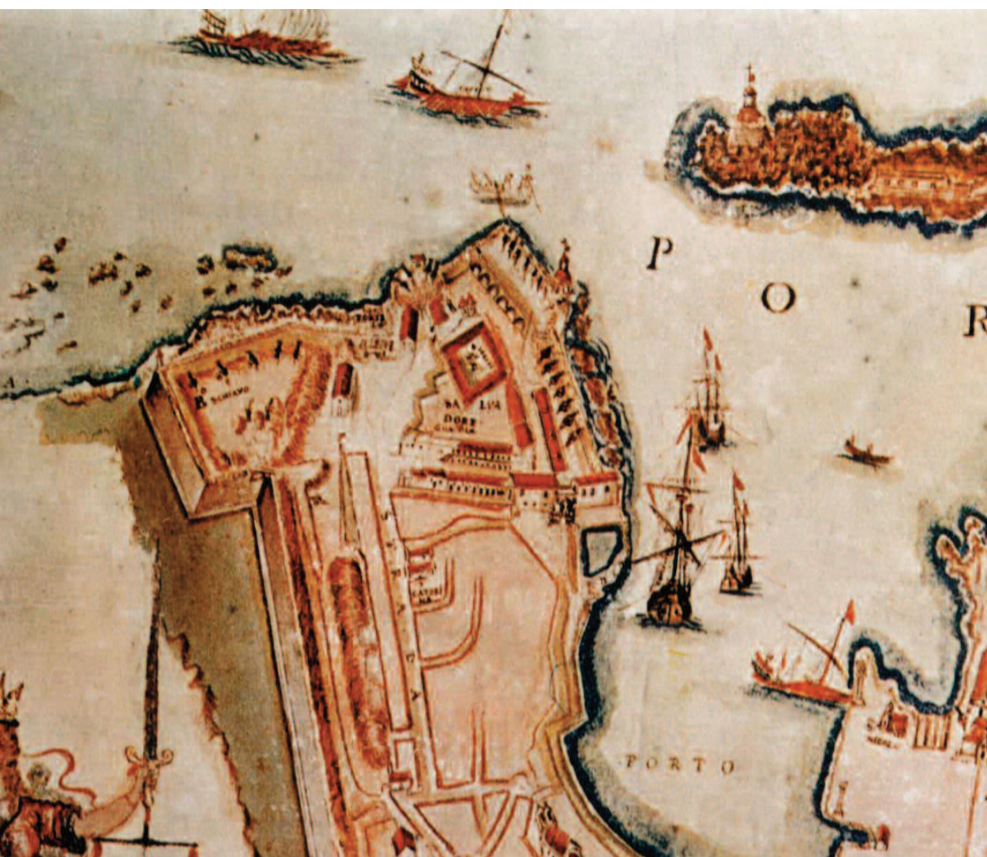
Χάρτης του Corner του 1625 που απεικονίζει όλο το τμήμα των οχυρώσεων.

είναι χαραγμένη η επιγραφή "PAX TIBI MARCE EVANGELISTA MEVS" (Ειρήνη σε εσένα Ευαγγελιστή Μάρκο).