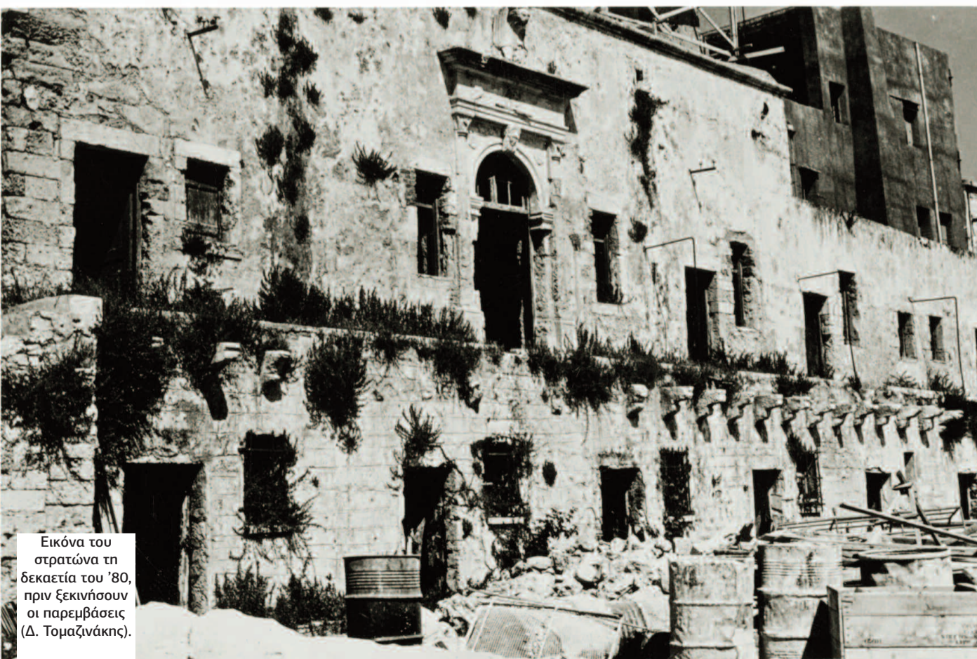
Εικόνα του στρατώνα τη δεκαετία του '80, πριν ξεκινήσουν οι παρεμβάσεις (Δ. Τομαζινάκης).