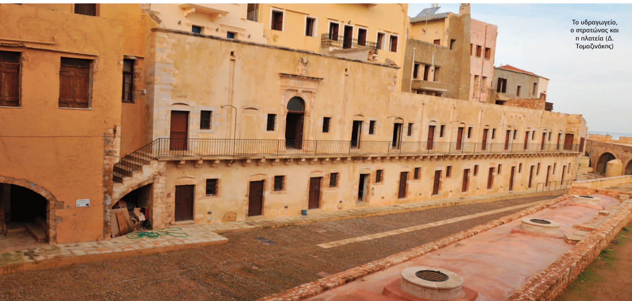
Το υδραγωγείο, ο στρατώνας και η πλατεία (Δ. Τομαζινάκης)