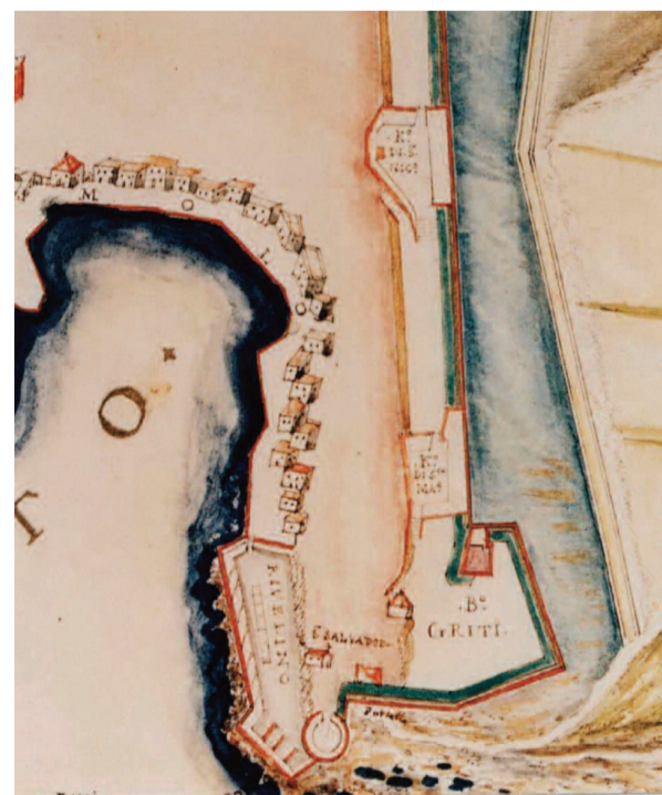
Λεπτομέρεια του χάρτη του Basilicata (1618) με το Rivellino Del Porto (Δ. Τομαζινάκης, Αρχείο Εφορίας Αρχαιοτήτων).