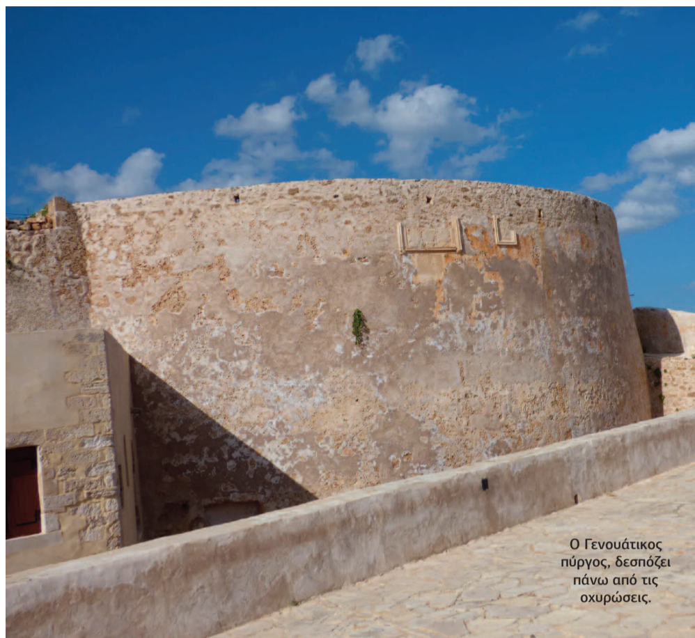
Ο Γενουάτικος πύργος, δεσπόζει πάνω από τις οχυρώσεις.

σε ασβεστολιθικό πέτρωμα. Το πρόσωπο έχει εκτεταμένες φθορές, στο κεφάλι φέρει στέμμα (κορώννα), οι φτερούγες του είναι όρθιες, πιεσμένες στο σώμα, ενώ στα πόδια του κρατά οικόσημα με περικεφαλαία - έμβλημα του δόγη Antonio Priuli και ανοικτό ευαγγέλιο στο οποίο