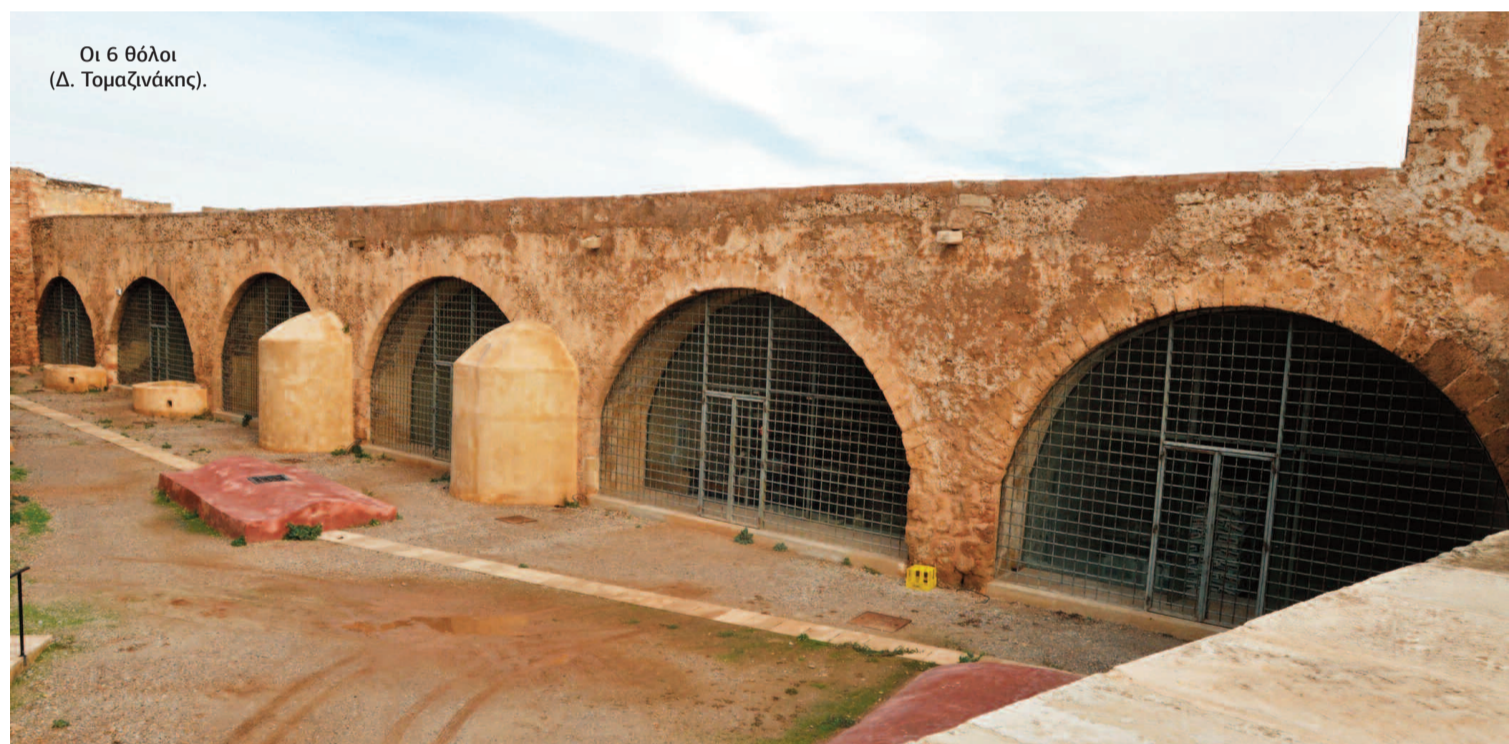
Οι 6 θόλοι (Δ. Τομαζινάκης).