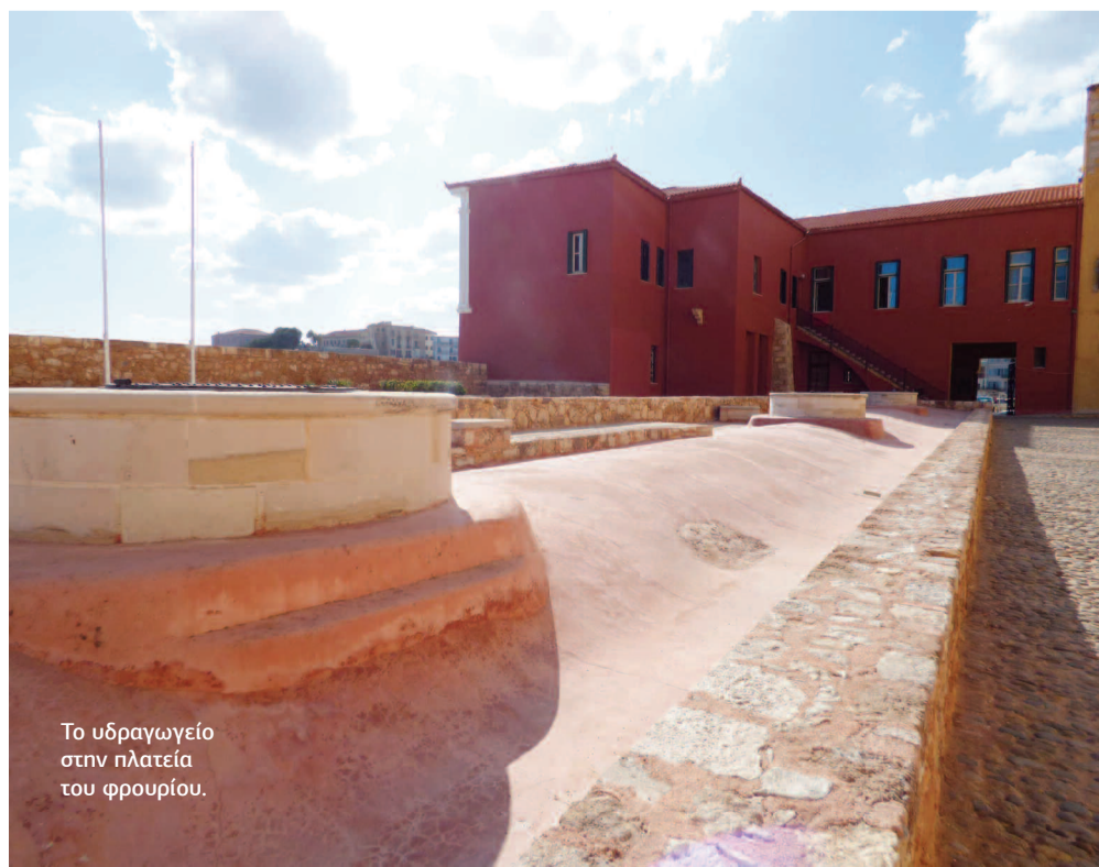
Το υδραγωγείο στην πλατεία του φρουρίου.

«Στην τειχοποιία εντοπίζουμε τη χαρακτηρι-