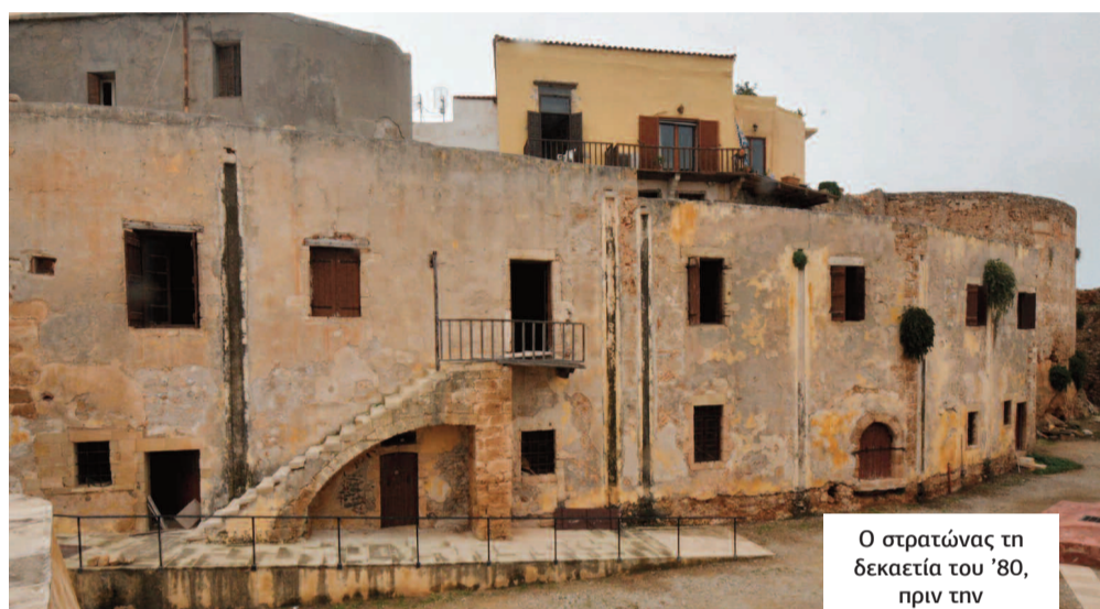
Ο στρατώνας τη δεκαετία του '80, πριν την ανακατασκευή του και μετά (Δ. Τομαζινάκης).