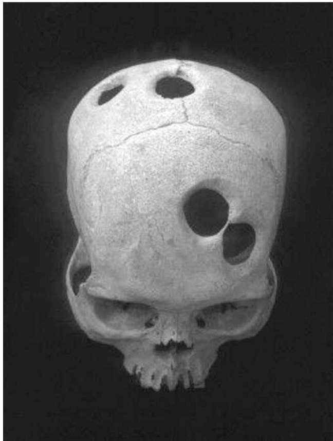
Κρανίο με θεραπευτικό τρυπανισμό, μετά τον οποίο ο ασθενής επέζησε για μεγάλο διάστημα, από τον πολιτισμό των Ίνκας στο σημερινό Περού (15ος αιώνας).