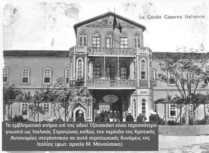
Το εμβληματικό κτήριο επί της οδού Τζανακάκη είναι περισσότερο γνωστό ως Ιταλικός Στρατώννας καθώς την περίοδο της Κρητικής Αυτονομίας στεγάστηκαν σε αυτό στρατιωτικές δυνάμεις της Ιταλίας.