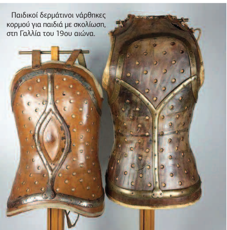
Παιδικό δερμάτινο νάρθηκας κορμού για παιδιά με σκολίωση, στη Γαλλία του 19ου αιώνα.