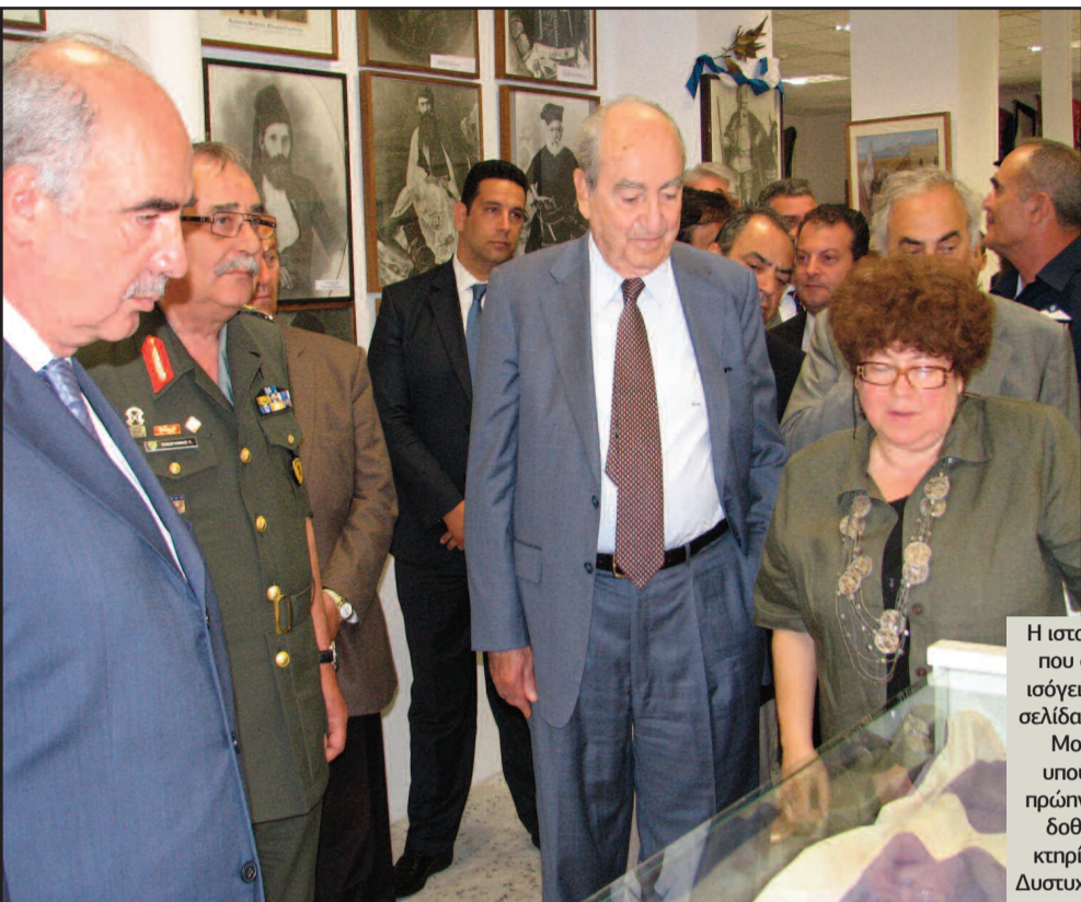
Η ιστορία του Πολεμικού Μουσείου Χανίων που φιλοξενήθηκε για κάποια χρόνια στο ισόγειο του κτηρίου αποτελεί μια ξεχωριστή σελίδα. Στα εγκαίνια της δεύτερης φάσης του Μουσείου το 2009, παρουσία του τότε υπουργού Άμυνας Β. Μείμαράκη και του πρώην πρωθυπουργού Κ. Μητσοτάκη, είχαν δοθεί υποσχέσεις για τη συντήρηση του κτηρίου και τη στήριξη του παραρτήματος. Δυστυχώς δεν τηρήθηκαν.