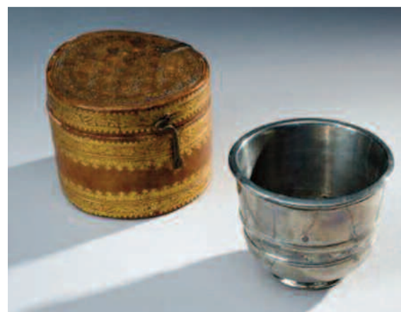
Δοχεία από το τοξικό στοιχείο αντιμόνιο. Οι αρχαίοι Ρωμαίοι έβαζαν μέσα κρασί για 24 ώρες, το οποίο έπαιρνε μεταλλική γεύση, ώστε πίνοντάς το να κάνουν εμετό και να μπορέσουν να συνεχίσουν το φαγοπότι στα περίφημα "συμπόσια"...