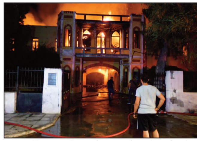
Στις 22 Ιουλίου 2018 τη νύχτα το κτήριο καταστράφηκε ολοσχερώς από την πυρκαγιά που ξέσπασε. Ένα ξεχωριστό μνημείο, που δεν εκτιμήθηκε και δεν προστατεύτηκε όπως θα έπρεπε, πέρασε στην ιστορία.