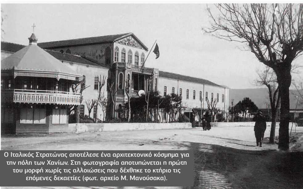
Ο Ιταλικός Στρατώννας αποτέλεσε ένα αρχιτεκτονικό κόσμημα για την πόλη των Χανίων. Στη φωτογραφία αποτυπώνεται η πρώτη του μορφή χωρίς τις αλλοιώσεις που δέχθηκε το κτήριο τις επόμενες δεκαετίες.

Μια παράδοση την οποία συνέχισαν με πολύ μεγάλη επιτυχία αυτοί οι δύο κατασκευαστές», σημειώνει ο κ. Μανούσακας.