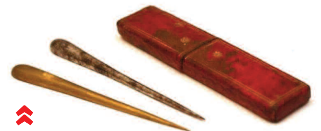
Γύρω στο 1800 η Elisha Perkins κατάφερε να κατοχυρώσει μια ευρεσιτεχνία με δύο ράβδους από "σπάνια" μέταλλα, που υπεστήριζε ότι θεραπεύαν κάθε νόσο αφού "αφαιρούν την αρνητική ροή από τη ρίζα της ασθένειας στο σώμα του ασθενούς". Οι ράβδοι πραγματοποίησαν μεγάλες πωλήσεις σε Ευρώπη και Αμερική, πριν αποδειχθεί ότι επρόκειτο για μια ακόμη απάτη για αφελείς...