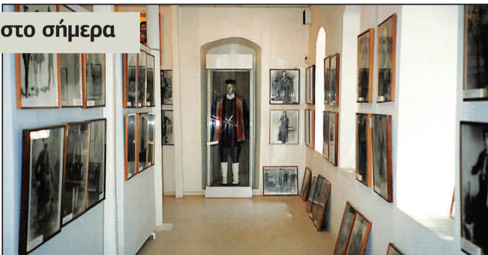
Στο μουσείο φιλοξενούνταν κειμήλια και ντοκουμέντα από τη συμμετοχή των Κρητικών στους απελευθερωτικούς αγώνες της Ελλάδας κατά τη διάρκεια του 20ου αιώνα.

Λίγο αργότερα στο σπουδαίο και εμβληματικό αυτό κτήριο θα βάλει τη σφραγίδα της κακογουστίας της η χούντα αφαιρώντας το περίτεχνο μαντεμένιο κάγκελο του εξώστη και τοποθετώντας στη θέση του δύο οριζόντιες σανίδες. Το 1980 το κτήριο θα χα-