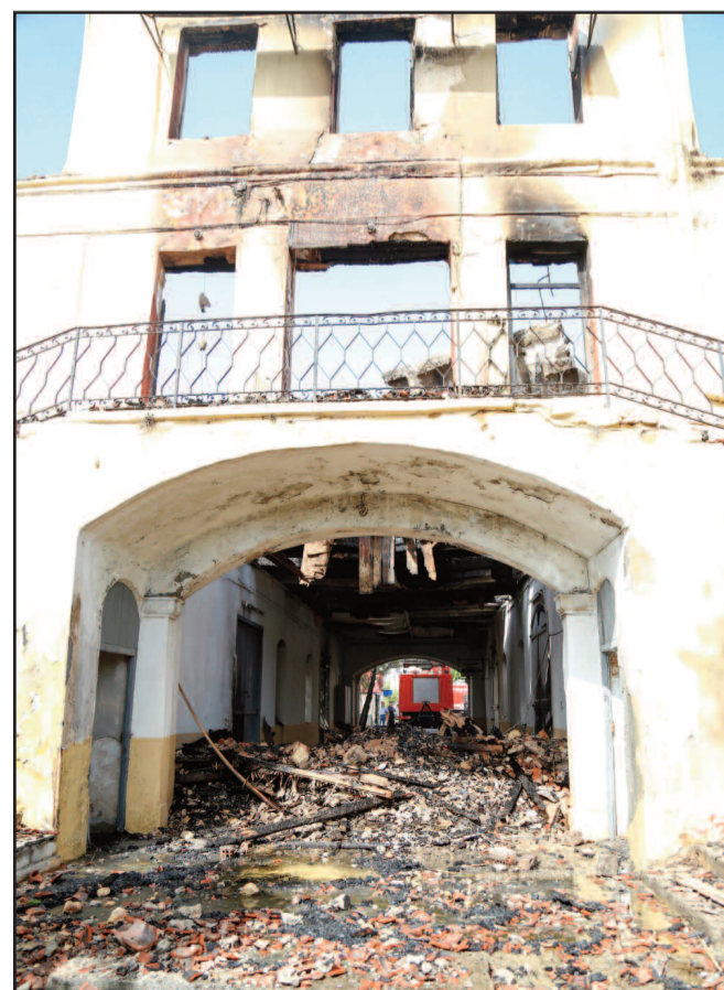
Την επομένη της καταστροφικής πυρκαγιάς η θέα του ιστορικού κτηρίου προκαλούσε θλίψη αλλά και πολλά αναπάντητα ερωτήματα για την εγκατάλειψη που είχε προηγηθεί.