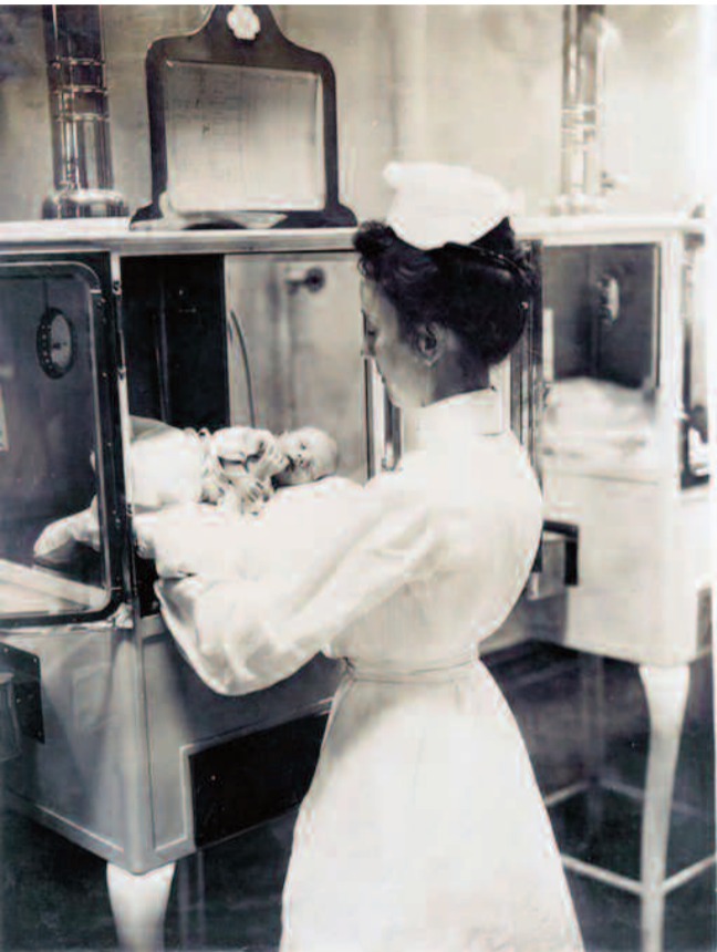
Μία από τις πρώτες θερμοκοιτίδες για την προστασία νεογνών, σε νοσοκομείο του Λονδίνου το 1904.