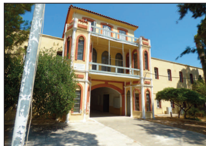
Ο Ιταλικός Στρατώννας φωτογραφημένος λίγες ημέρες πριν παραδοθεί στις φλόγες. Το κτήριο είχε απαξιωθεί και βρισκόταν σε εγκατάλειψη για χρόνια ολόκληρα.

Την επόμενη αμέσως ημέρα ανακοινώθηκε από τον υπουργό Περιβάλλοντος και Ενέργειας Γιώργο Σταθάκη η δέσμευση 6 εκατ. ευρώ από το Πρόγραμμα Δημοσίων Επενδύσεων για την ανακατασκευή του ιστορικού κτηρίου. Απομένει να δούμε αν το έργο θα προχωρήσει προκειμένου ο Ιταλικός Στρατώννας να μην περάσει στην επικράτεια των αναμνήσεων.