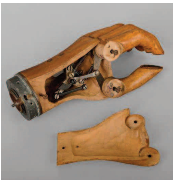
Ξύλινο προσθετικό χέρι της δεκαετίας του 1920. Διέθετε σύστημα συστροφής, ενώ με περίπλοκο μεταλλικό μηχανισμό στο εσωτερικό του, επέτρεπε αρκετές στοιχειώδεις, αλλά καίριες, κινήσεις των δακτύλων...