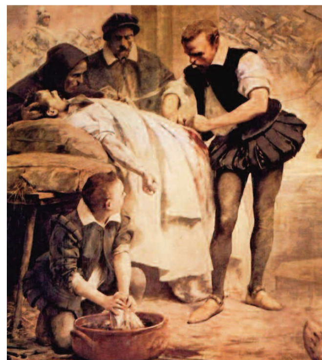
Ο Ambroise Paré (1509-1590), διάσημος Γάλλος κουρέας-χειρουργός, προσωπικός γιατρός 4 βασιλιάδων, θεωρείται ένας από τους πατέρες της χειρουργικής, με αξιόλογη προσφορά στις τεχνικές των επεμβάσεων, στην αντιμετώπιση των τραυμάτων σε μάχες και στην ανατομία.