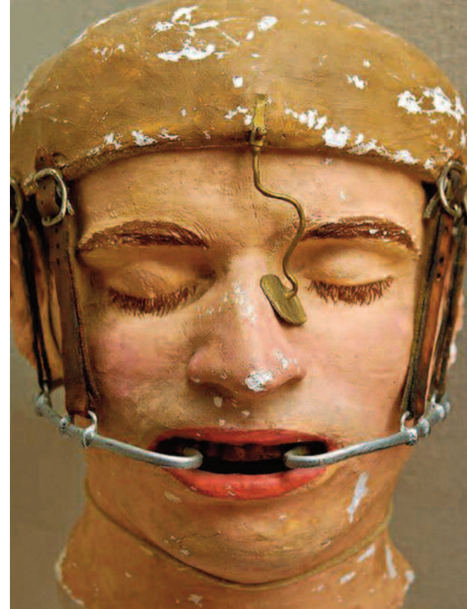
Πήλινο ομοίωμα στρατιώτη με ειδική συσκευή στο πρόσωπο, για την αποκατάσταση σοβαρών αλλοιώσεων από τραυματισμούς, πριν την επέκταση της πλαστικής χειρουργικής, λίγο μετά τον Α' Παγκόσμιο Πόλεμο.