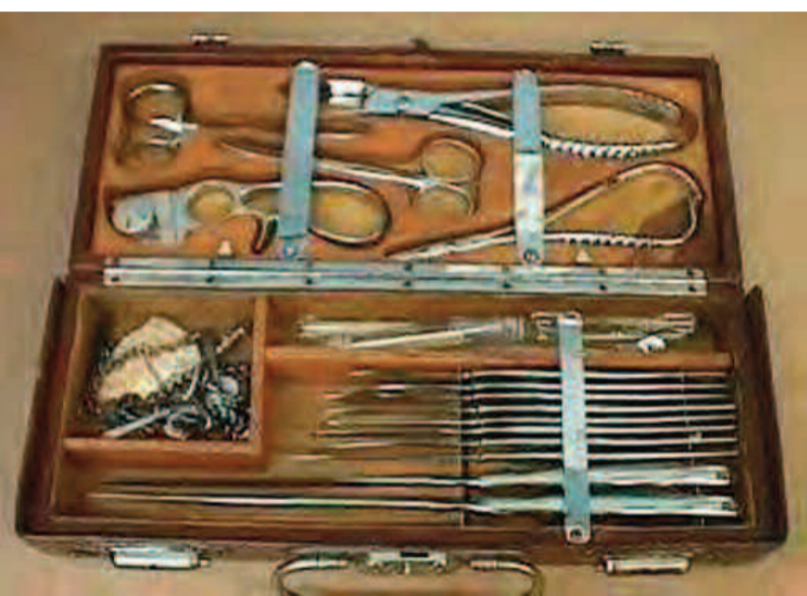
Θήκη με ιατρικά εργαλεία, Νέα Υόρκη, 1890-1900.