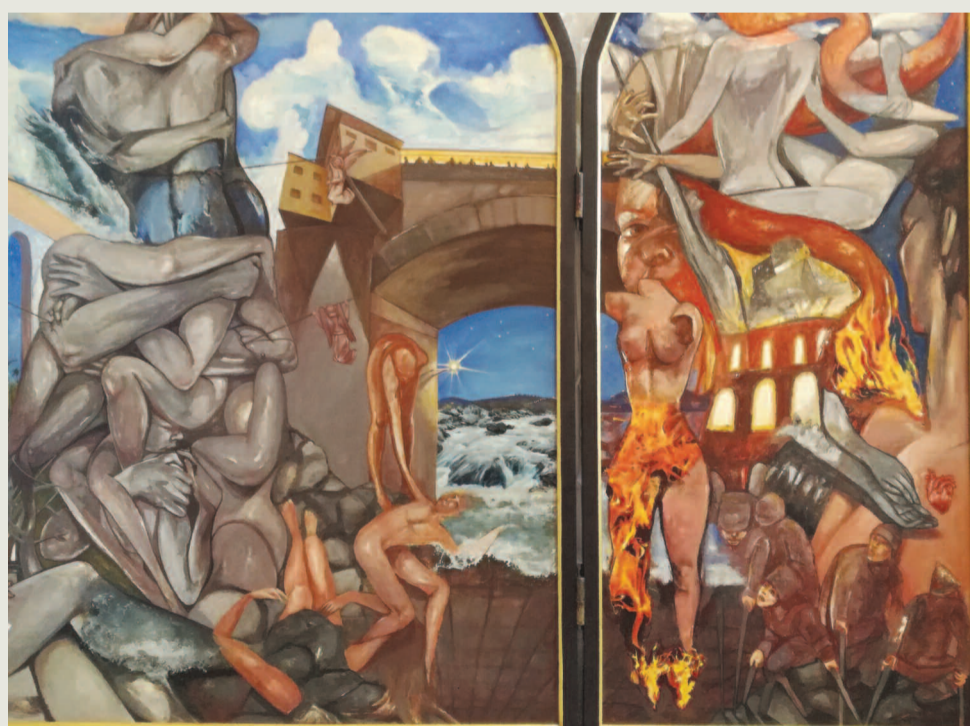
“ Forma locutionis - Ιστορίες ανθρώπων και μνήμες παράλληλες της λήθης ”, (λεπτομέρεια του έργου), αλληγορία των στοιχείων της φωτιάς, του νερού και της σημασίας της ανθρώπινης επαφής.

Στο έργο αυτό, διακρίνεται στα δεξιά η καρδιά μετά τη καταστροφή, η οποία αν και σίγουρα τραυματισμένη, μένει παραδόξως