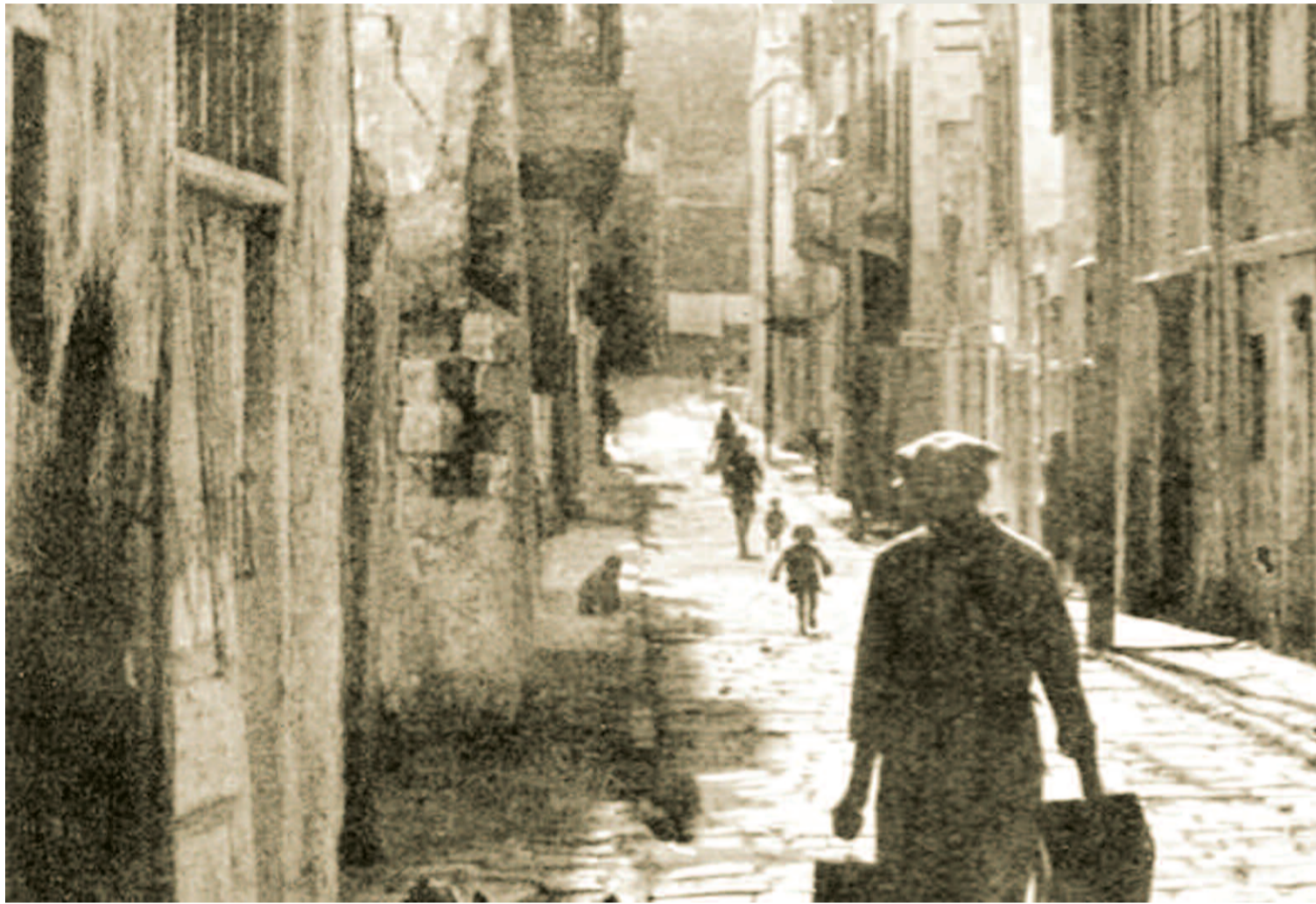
Γωνία Κονδυλάκη και Πόρτου με τη Συναγωγή Μπεθ Σαλόμ (στη γωνία δεξιά) το 1937

Στη διάρκεια του πολέμου μεταξύ Βενετίας και Οθωμανικής Αυτοκρατορίας, η πόλη του Χάνδακα ερημώθηκε από την οποία οι Εβραίοι με πολλοί Χριστιανοί κάτοικοι της μετοίκησαν στα Ιόνια νησιά. Έτσι, το 1669 εγκαινιάστηκε στη Ζάκυνθο η συναγωγή των Εβραίων προσφύγων της Κρήτης η οποία ονομάστηκε «Κρητι-