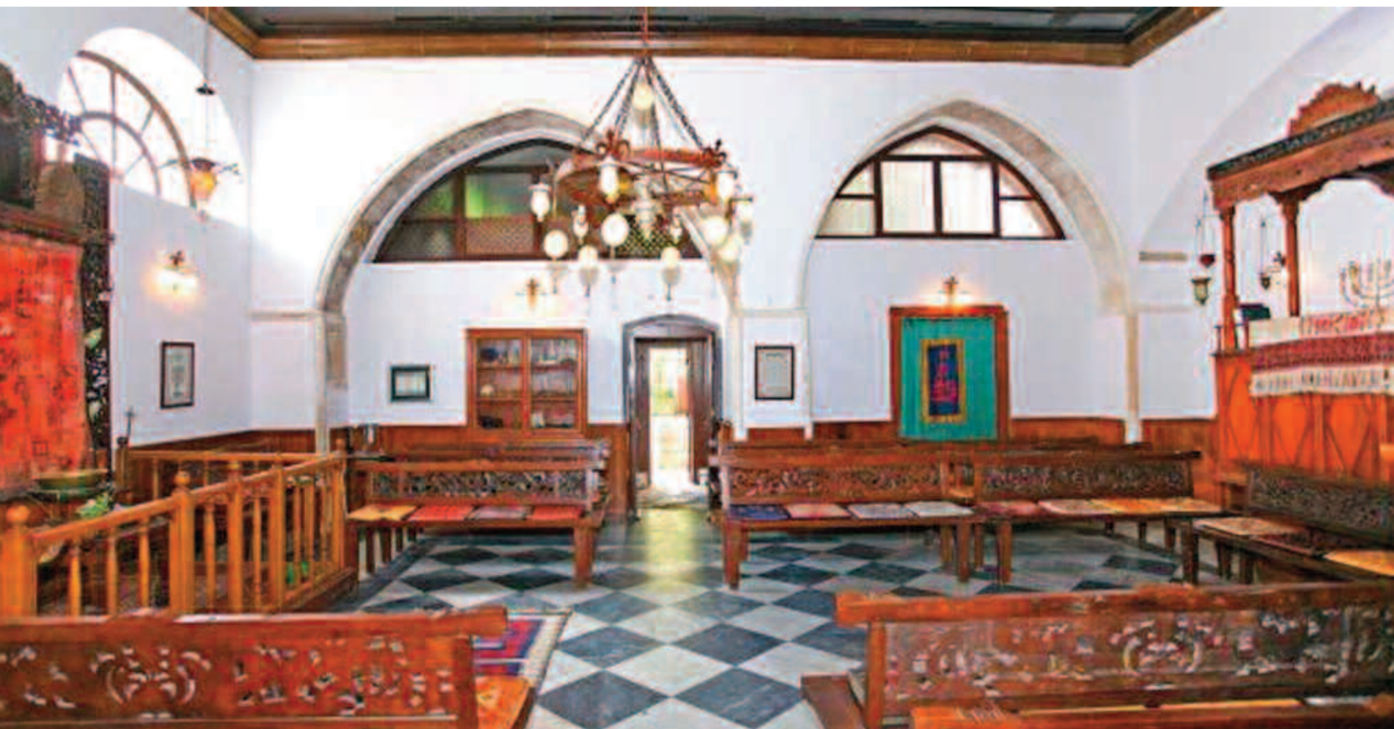
Η συναγωγή Ετζ Χαγίμ εσωτερικά μετά την πλήρη αποκατάσταση

Το απόγευμα της 7ης Ιουνίου, οι περίπου 350 Εβραίοι μαζί με 250 Κρητικούς κρα-