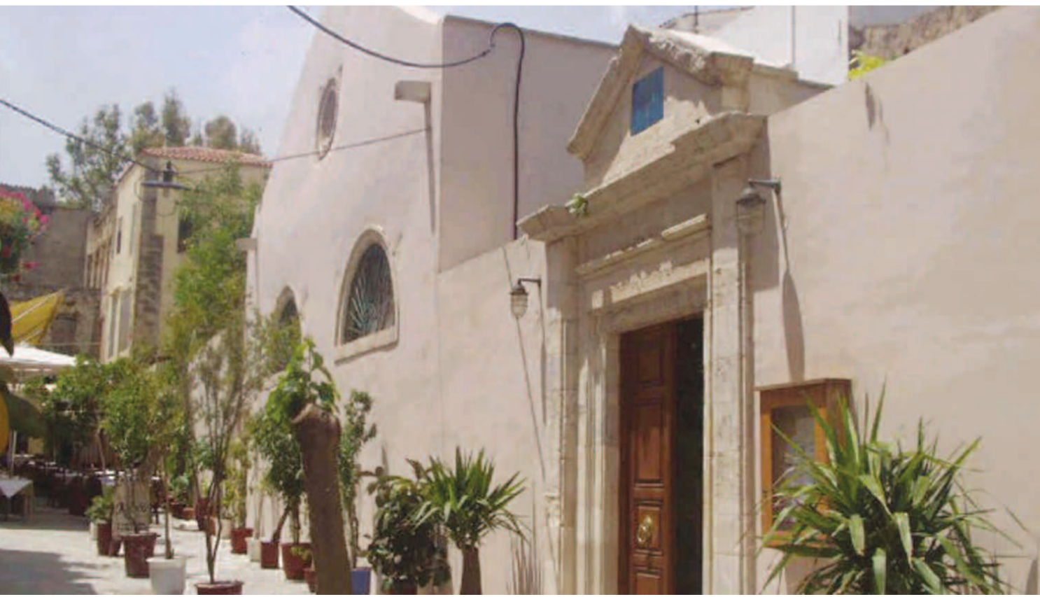
Η εξωτερική όψη της συναγωγής Ετζ Χαγίμ

Η κατάκτηση της Κρήτης από τους Οθωμανούς χρειάστηκε περίπου όλο τον 17 ο αιώνα για να πραγματοποιηθεί. Το δυτικό τμήμα του νησιού έπεσε σχετικά γρήγορα στον οργανωμένο στρατό του Γιουσούφ Πασσά. Όμως, για την κατάληψη του Ηρακλείου χρειάστηκε μία 20ετής περίπου πολιορκία, έως ότου το κάστρο καταληφθεί από τους Οθωμανούς. Η πορεία των Εβραίων της Κρήτης άλλαξε άρδην κάτω από την οθωμανική διοίκηση. Τα γκέτο στις πόλεις άνοιξαν και οι Εβραίοι μπορούσαν να κατοικήσουν και σε περιοχές που είχαν εγκαταλειφθεί από τους Ενετούς. Η Κρήτη γενικότερα μπήκε σε μια διαφορετική οικονομική τροχιά και λιμάνια όπως αυτά της Ιεράπετρας, του Ρεθύμνου και των Χανίων άρχισαν επικοινωνία με την Σμύρνη, την Αλεξάνδρεια και τη Βεγγάζη. Ο Εβραϊκός πληθυσμός συνεχίζει να αυξάνεται με γρήγορους ρυθμούς, κάτι που πιθανόν να σχετίζεται και με τη μεταφορά της πρωτεύουσας του Ελαγιετίου της Κρήτης στα Χανιά στα 1850. Έτσι, όπως πληροφορούμαστε από τη « Χωρογραφία Κρήτης, συνταχθείσα τω 1818 υπό Ζαχαρίου Πρακτικίδου, παρεισάκιου πληρεξουσίου και γενικού φροντιστού της δικαιοσύνης τω 1822-1829 εν Κρήτη », (Νέα έκδοση, Ηρά-