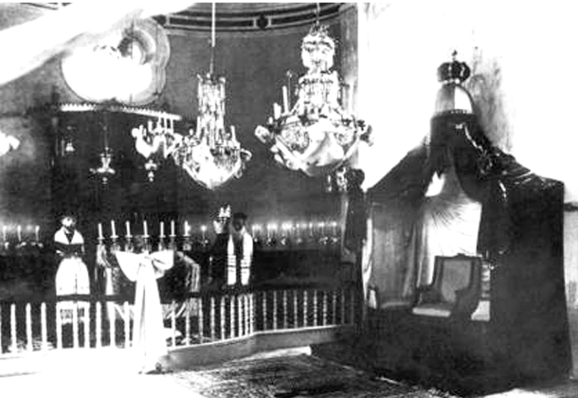
Εσωτερικό Μεγάλης Συναγωγής Μπέθ Σαλόμ. Λεύκωμα Φιλολ. Συλλόγου «Χρυσόστομος» λίγο πριν την επίσκεψη του βασιλιά Κωνσταντίνου στις 1-12-1913 μέρα της Ένωσης της Κρήτης με την Ελλάδα.