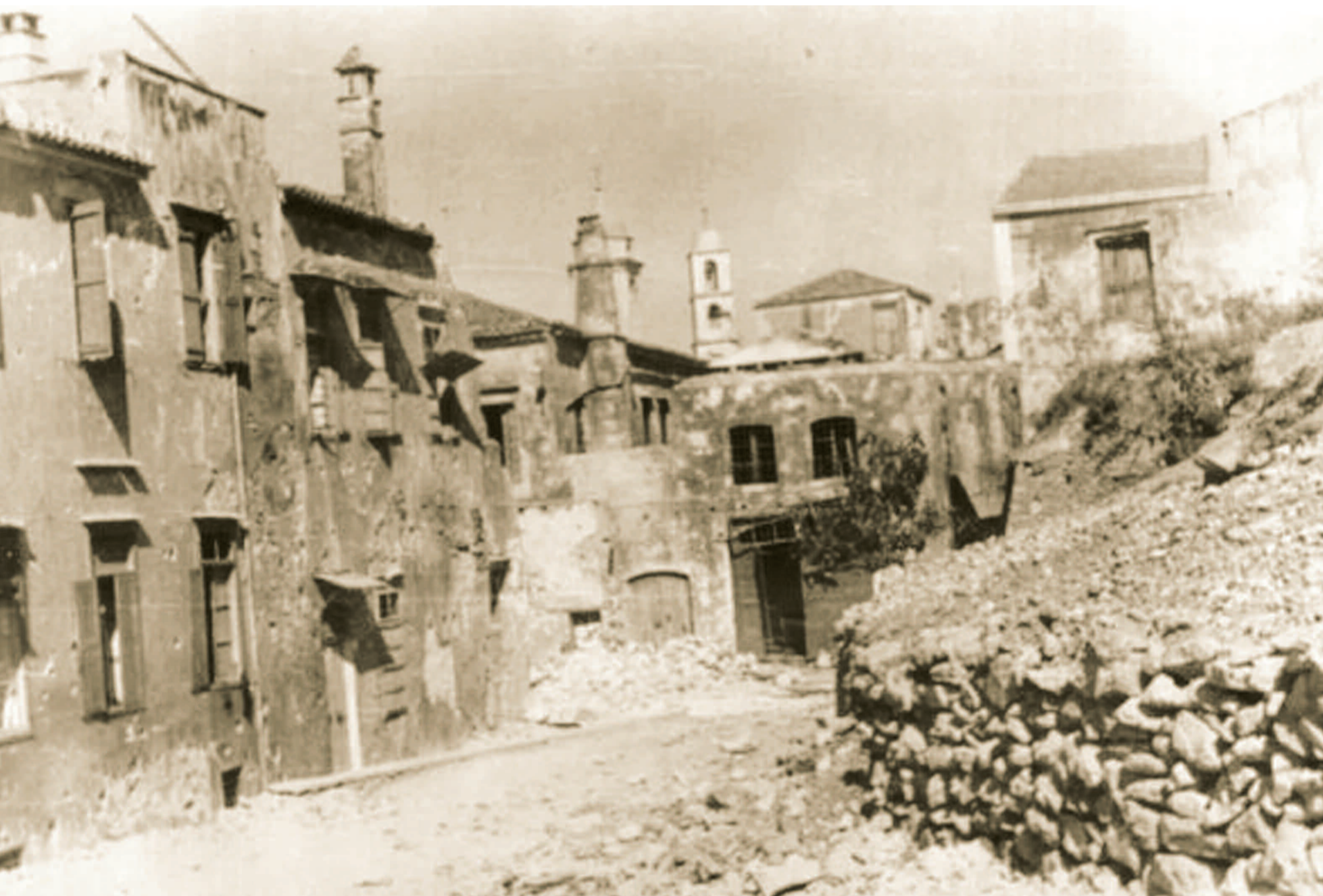
Η βομβαρδισμένη Συναγωγή το 1942

όταν τα Οθωμανικά στρατεύματα αποπλίστηκαν και εγκατέλειψαν την Κρήτη, οι Εβραίοι πανικοβλήθηκαν. Ιδιαίτερα βλέποντας ότι εκτός από τους Τούρκους και αρκετές χιλιάδες Κρήτες μουσουλμάνοι αποχωρούσαν μαζί τους, μη νοιώθοντας ασφάλεια, παρά τις εγγυήσεις που παρέιχαν οι λεγόμενες Μεγάλες Δυνάμεις της εποχής για την προστασία τους. Ο αρχι-