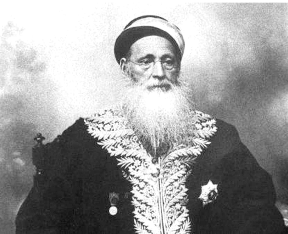
Αρχираββίνος Αβραάμ Εβλαγόν. Έχαιρε μεγάλης εκτίμησης από την Χανιώτικη κοινωνία

Αναλύοντας τα ευρήματα από την καταγραφή των μελών της Εβραϊκής κοινότητας στα Χανιά, αξίζει να σημειώσουμε ότι η συντριπτική τους πλειοψηφία από την εποχή της Οθωμανικής κατάκτησης της πόλης των Χανίων στα 1252, και για μεγαλύτερη ασφάλεια, εγκαταστάθηκαν σε μια οριοθετημένη από του Ενετούς περιοχή που ονομάστηκε judeca , ανατολικά της αριστοκρατικής παλιάς συνοικίας Τοπχανάς και συγκεκριμένα στο τετράγωνο που περικλείεται από τους σημερινούς δρόμους Κονδυλάκη-Πόρτου-Σκουφών-Ζαμπελίου και που ακόμα και σήμερα ονομάζεται Εβραϊκή ή Οβριακή. Υπήρχαν δε δύο συναγωγές. Αργότερα, με την επέ-