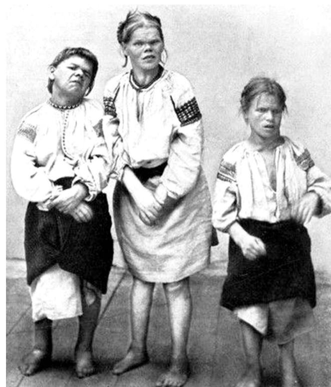
Αδέλφια που πάσχουν από κρετινισμό (σύνδρομο που προκαλείται από έλλειψη θυρεοειδικής ορμόνης κατά τη γέννηση και προκαλεί νοητική υστέρηση), στην Ουκρανία των αρχών του 20ου αιώνα...