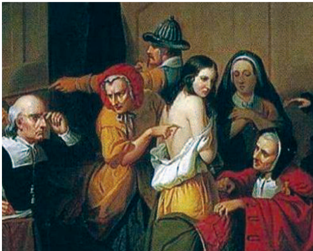
Τον Μεσαίωνα, σε αρκετές περιπτώσεις, άμοιρες γυναίκες ξεγυμνώνονταν και στο σώμα τους αναζητούνταν από "ειδικούς" σημάδια του σατανά. Ακόμη και μια απλή γρατζουνιά μπορούσε να τις οδηγήσει σε φρικτά βασανιστήρια ή και σε θάνατο στην πυρά, με την κατηγορία της μάγισσας...