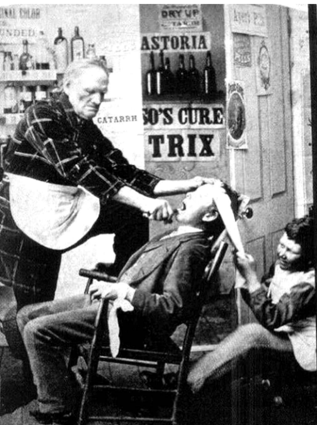
Αυτοδίδακτος "οδοντίατρος" με τον βοηθό του, τη στιγμή που επιχειρεί εξαγωγή δοντιού σε μπακάλικο στη Νέα Υόρκη το 1892...