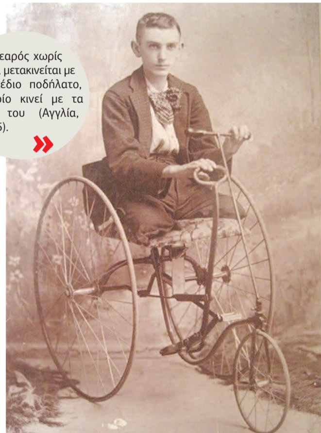
Νεαρός χωρίς πόδια, μετακινείται με αυτοσχέδιο ποδήλατο, το οποίο κινεί με τα χέρια του (Αγγλία, 1885).