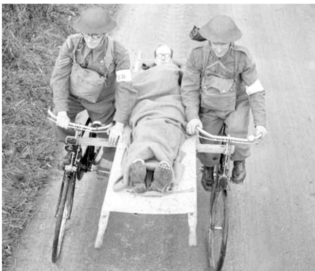
Ασθενοφόρο που κινείται με ποδήλατα, την περίοδο του 1ου Παγκοσμίου Πολέμου.