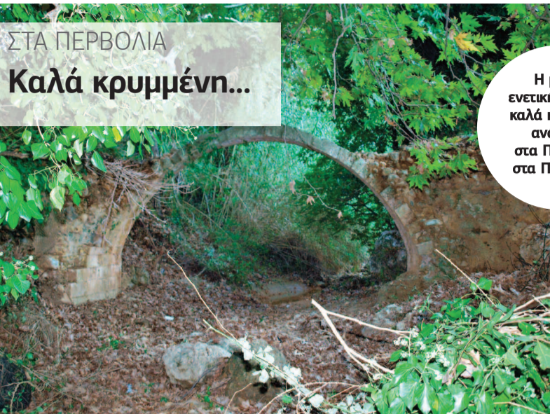
ΣΤΑ ΠΕΡΒΟΛΙΑ Καλά κρυμμένη...