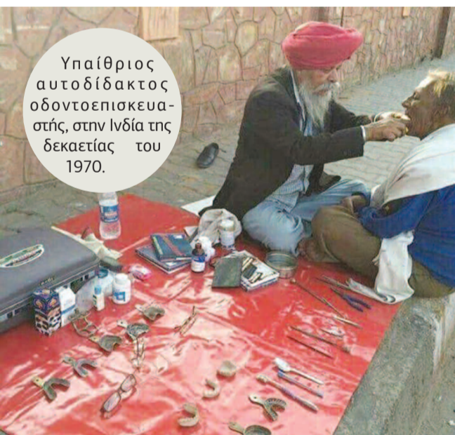
Υπαίθριος αυτοδίδακτος οδοντοεπισκευαστής, στην Ινδία της δεκαετίας του 1970.