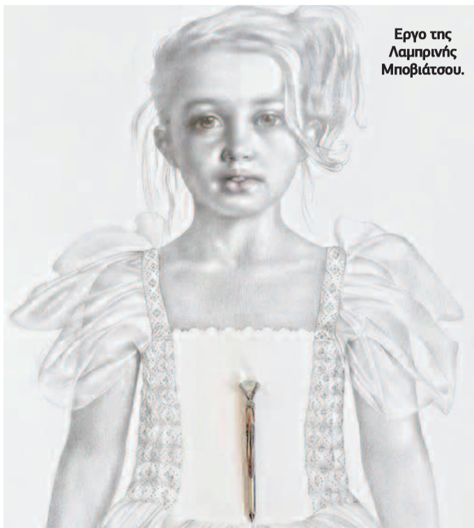
Έργο της Λαμπρινής Μποβιάτσου.