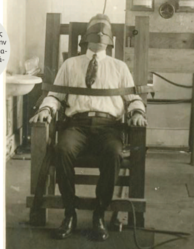
Η ηλεκτρική καρέκλα σχεδιάστηκε το 1889 από τον οδοντίατρο Αλφρεντ Σάουθγουικ και χρησιμοποιήθηκε μέχρι το 2006 σε 27 πολιτείες της Αμερικής (αλλά και τις Φιλιππίνες) για την εκτέλεση 4.461 εγκληματιών, μέσω της χορήγησης ρεύματος τάσης 1.700-2.200 Volts στο σώμα τους.