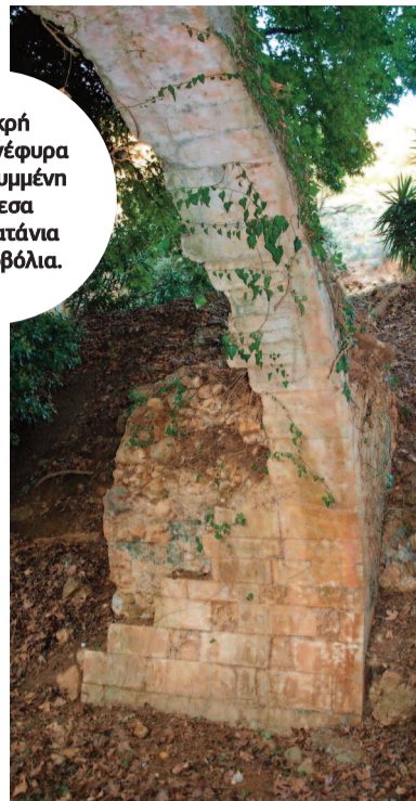
Η μικρή ενετική γέφυρα καλά κρυμμένη ανάμεσα στα Πλατάνια στα Περβόλια.