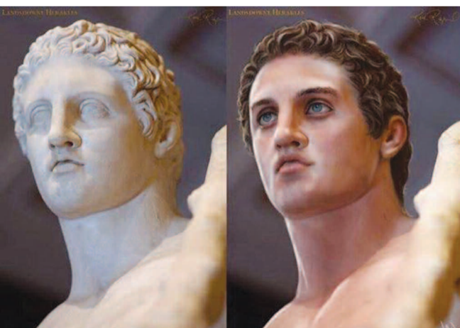
Κέρινο ομοίωμα της πιθανής μορφής του Μεγάλου Αλεξάνδρου, με βάση διασωθέν άγαλμά του και ιστορικές αναφορές.