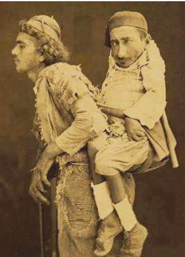
Τυφλός άνδρας μεταφέρει στην πλάτη τον παραπληγικό φίλο του, που έχει την όρασή του αλλά δεν μπορεί να περπατήσει, ώστε να του δείχνει το δρόμο. Τραγικές φιγούρες από τη Δαμασκό της Συρίας το 1889.