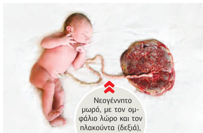
Νεογέννητο μωρό, με τον ομφάλιο λώρο και τον πλακούντα (δεξιά), αμέσως μετά τη γέννα.