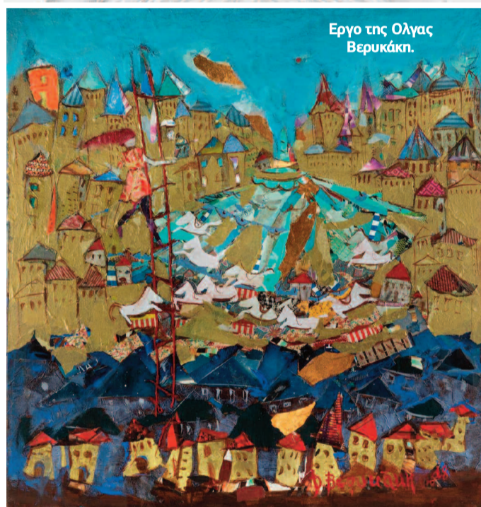
Έργο της Όλγας Βερυκάκη.