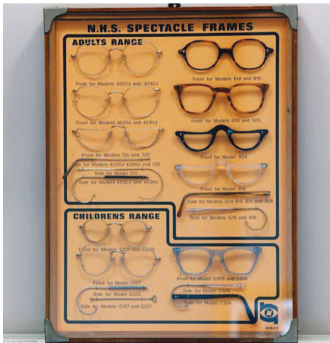
Διαφήμιση σκελετών γυαλιών ενηλίκων και παιδιών, από την εταιρεία "The Algha Works", η οποία ίδρυσε εργοστάσιο οπτικών ειδών στο Λονδίνο το 1932.