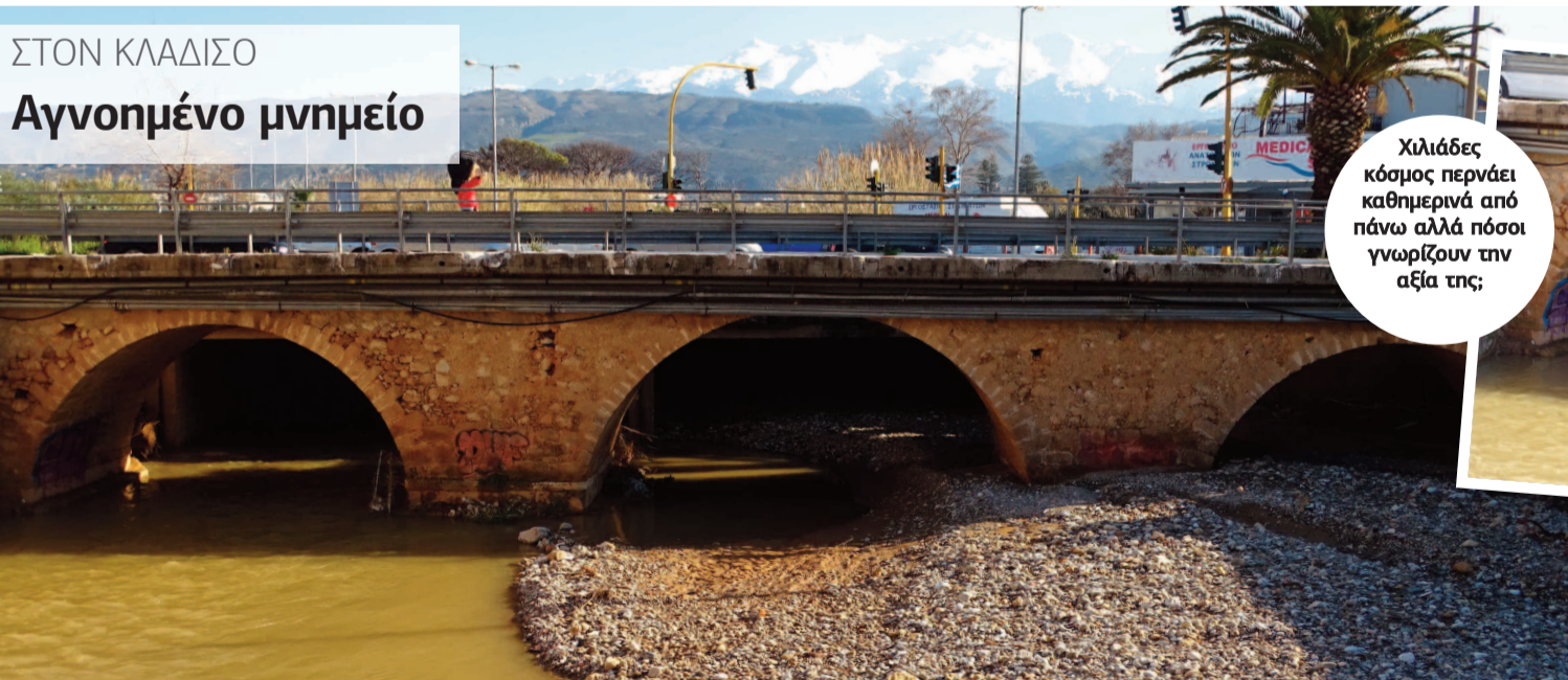
Χιλιάδες κόσμος περνάει καθημερινά από πάνω αλλά πόσο γνωρίζουν την αξία της;