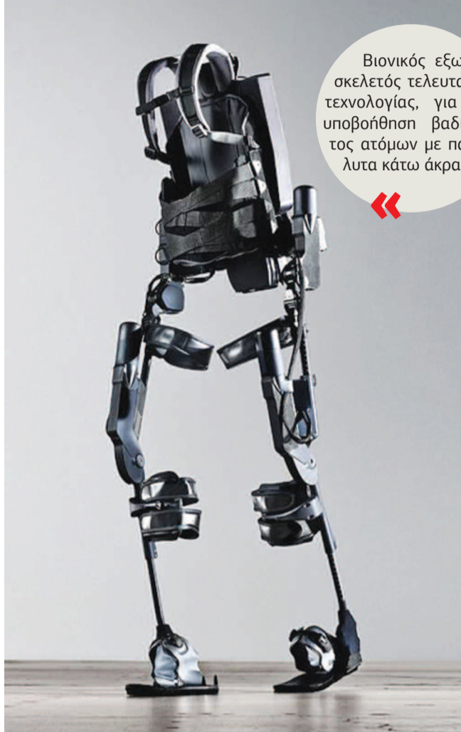
Βιονικός εξωσκελετός τελευταίας τεχνολογίας, για την υποβοήθηση βαδίσματος ατόμων με παράλυτα κάτω άκρα.