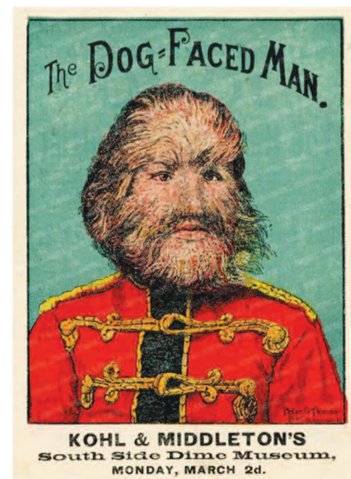
Ο άνθρωπος με το πρόσωπο σκύλου: ένα από τα πιο περίεργα εκθέματα του τσίρκου Barnum των τελευταίων 50 ετών", σε αφίσα του 1884.