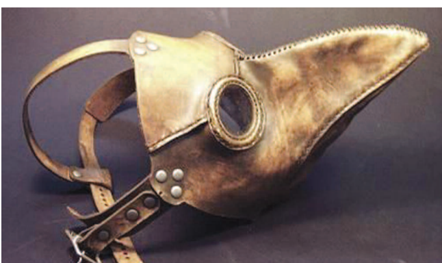
Η βουβωνική πανώλη, γνωστή και ως "Μαύρος Θάνατος" οδήγησε πάνω από 75 εκατομμύρια ανθρώπους σε 3 πλείρους στο θάνατο, στα μέσα του 14ου αιώνα. Οι γιατροί της εποχής, φορούσαν ειδικές μάσκες, με αρωματικά φυτά στο ράμφος, στην προσπάθειά τους να προστατευτούν από την οσμή της σήψης και τη μετάδοση τη νόσου.