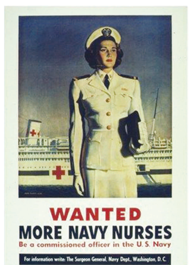
"Ζητούνται περισσότερες νοσοκόμες για το ναυτικό". Αφίσα για την προσέλκυση εθελοντριών νοσοκόμων στα αμερικανικά πλοία, κατά το 2ο Παγκόσμιο Πόλεμο.