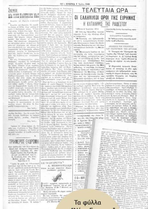
Τα φύλλα της "Νέας Ερευνας" που δημοσίευσαν την εργασία των μαθητών.

Ο ενθουσιασμός των κατοίκων είναι απερίγραπτος. Γυναίκες άλλαι μεν προσφέρουν εις ημάς δίσκους πλήρεις οπωρών άλλαι δε τεμάχια άρτου και τυρού. Τοσαύτη ήτο η ευχαρίστησις ημών όποτε άνεχωρούμεν εζτωκραυγάσαμεν υπέρ των κατοίκων της Σηπλιάς. Περί την 7ην ώραν και 30’ εφθάνομεν εις την Μονήν. Αφού επ’ αρκετήν ώραν εις την μεγάλην τάραντα της Μονής διασκεδάσαμεν μετέβημεν κατόπιν εις το εστιατόριον. Καταλαμβάνομεν τας θέσεις μας παρά τη τραπέζη και ετοιμαζόμεθα προς δείπνον. Προ του δείπνου ο οσιώτατος ιερομόναχος κ. Βενέδικτος μας εξιστόρισε τα του βομβαρδισμού της Μονής υπό των Τούρκων κατά την επανάστασιν του 1866 ούτως ίχνη διασώζονται μέχρι σήμερα καθώς ήκουσε ταύτα παρά μοναχών ζώντων την εποχήν εκείνην. Μετά την αφήγησιν των γεγονότων τούτων αρχίσαμεν να δειπνώμεν. Περί την 11 πνευγυρόμεθα και μεταβαίνομεν εις τον κοιτώνα μας δι’ ύπνον λίαν συγκεκνημένοι εκ των πολλών περιποιήσεων των μοναχών. Περί την 5ην πρωινήν ώραν της 3ης Ιουνίου εγειρόμεθα και ετοιμαζόμεθα όπως επιστρέψωμεν εις την αγα-