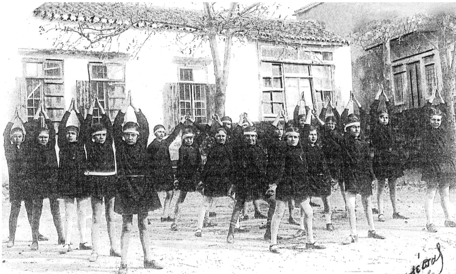
Στην αυλή μπροστά από το κτίριό του Ανώτερου Δημοτικού Σχολείου Χαλέπας οι μαθητές εκτελούν γυμναστικές ασκήσεις.

Λίγους μήνες πριν από την επίσημη ένωση της Κρήτης με την Ελλάδα, την 1η Δεκεμβρίου 1913 με την ύψωση της γαλανόλευκης στο φρούριο Φιρκά και μετά το νικηφόρο αποτέλεσμα του Α΄ Βαλκανικού πολέμου, στην οποία σημαντική ήταν η συμβολή της Κρήτης, οι Κρητικοί δάσκαλοι καλλιεργούσαν στους μαθητές τους έντονα το πατριωτικό πνεύμα εναρμονισμένο με το κλίμα της εποχής.