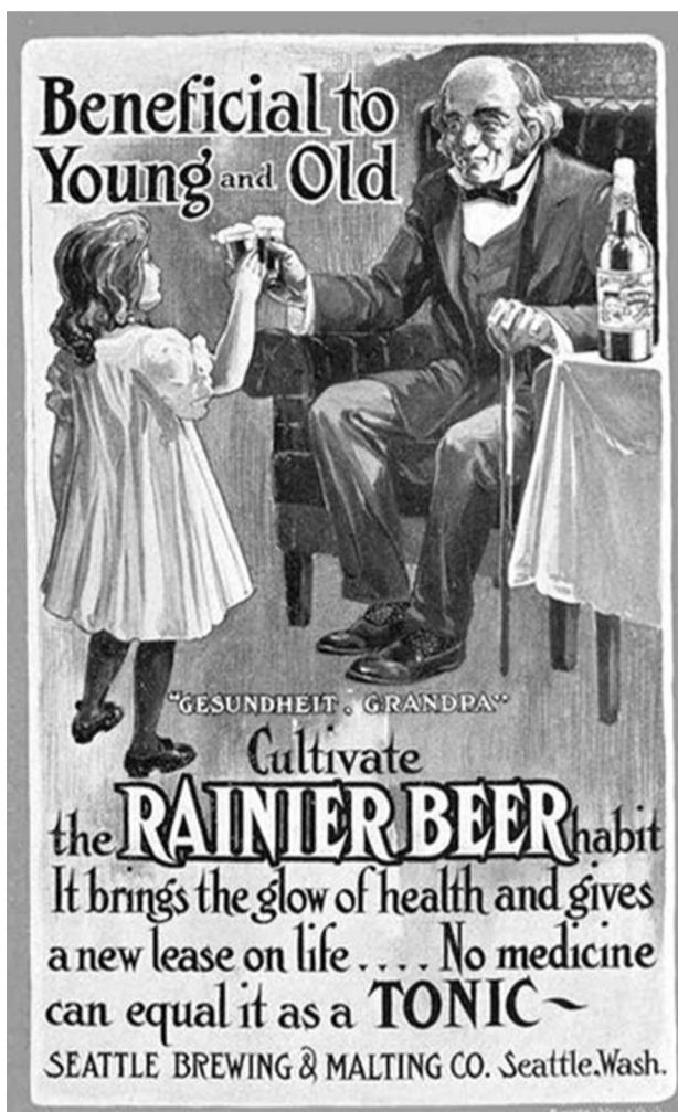
"Μπύρα Rainier, ωφέλιμη για την υγεία μικρών και μεγάλων - Ως τονωτικό, καλύτερη και από τα ιατρικά σκευάσματα". Νόμιμη διαφήμιση, στο Σιάτλ των ΗΠΑ του 1900.