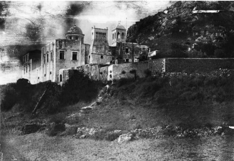
Πανοραμική άποψη της Μονής Γωνιάς κατά τις αρχές του 20ου αιώνα.