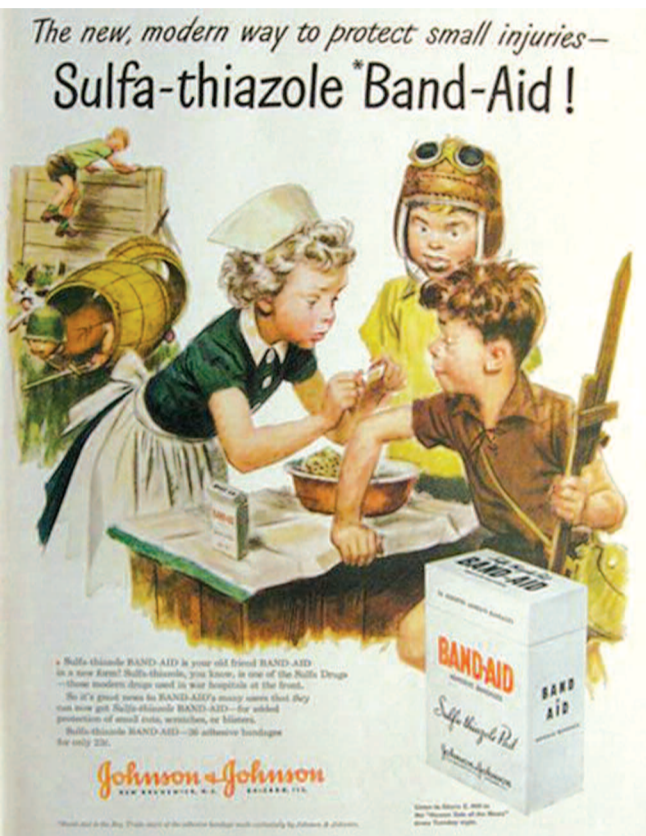
Τσιρότα Band Aid της εταιρείας Johnson & Johnson: "Ο νέος, μοντέρνος τρόπος για τις μικρές πληγές των παιδιών" (1943).