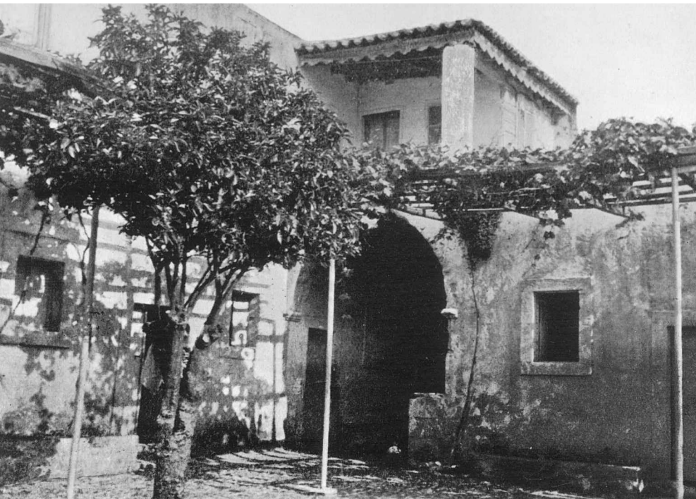
Αποψη της αυλής της Μονής Γωνιάς στην ανατολή του 20ου αιώνα