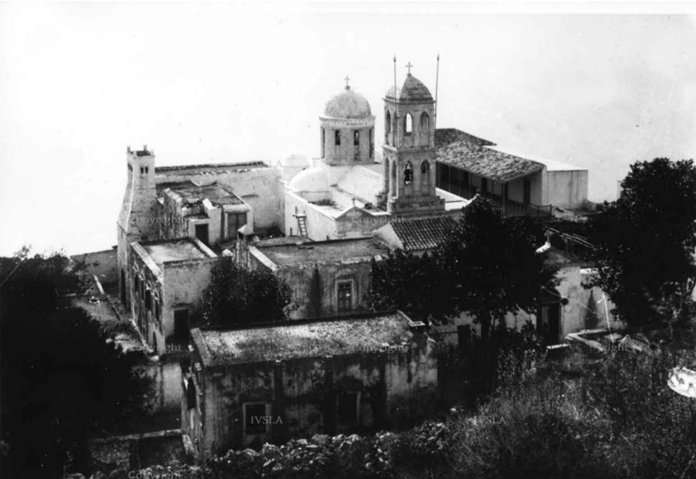
Το κτιριακό συγκρότημα της Μονής Γωνιάς (Κυρίας των Αγγέλων) που διαδραμάτισε σπουδαίο ρόλο στην Κρητική ιστορία το 1902 με 1903.

χαγωγικού σκοπού παρακαλεί δε τούτους όπωσ ευαρεστούμενοι επιτρέψωσιν εις αυτόν όπωσ ενοχλήση τούτους κατά τας δύο ημέρας καθ' ας θα διεμύνωμεν.