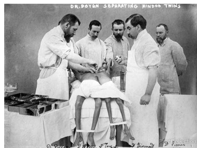
Ο Γάλλος χειρουργός Dr. Eugne-Louis Doyen το 1902 πραγματοποιεί επείγουσα επέμβαση διαχωρισμού των Ινδών σιαμαίων Radica και Doodica, ενώ το ένα κορίτσι είχε προσβληθεί από φυματίωση, με την ελπίδα να σωθεί το δεύτερο. Η Doodica πέθανε αμέσως μετά την επέμβαση, ενώ η Radica ένα χρόνο μετά, και οι δύο από φυματίωση.