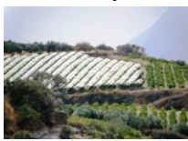
Σταφύλια όψιμης συγκομιδής