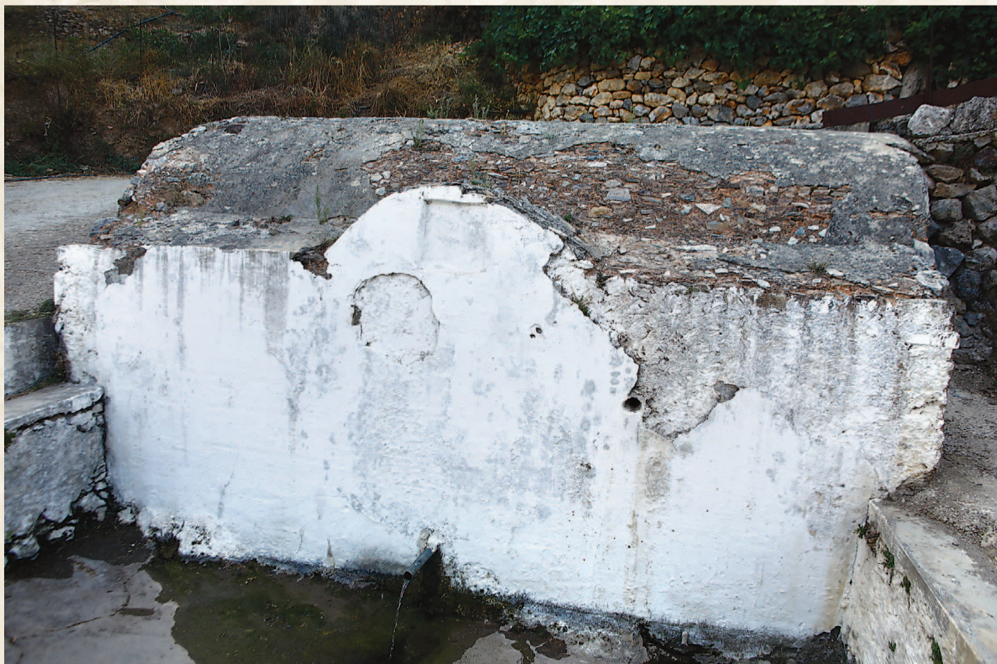
Η Ενετική δεξαμενή, παρακείμενη του ναού και ίδιας περιόδου.