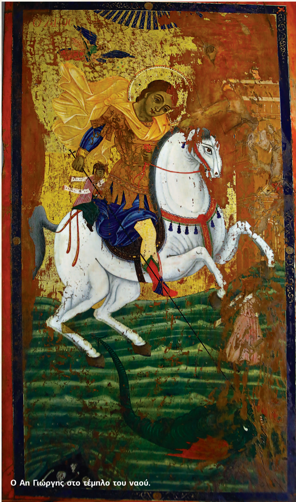
Ο Αη Γιώργης στο τέμπλο του ναού.

σης και από τις ανασκαφικές έρευνες, προέκυψαν στοιχεία, τα οποία ο κ. Ψαράκης αναφέρει στην αρχαιολογική έκθεση που συνέταξε: