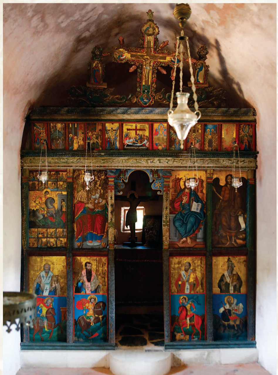
Το τέμπλο του Αγίου Γιώργη των Λάκκων.