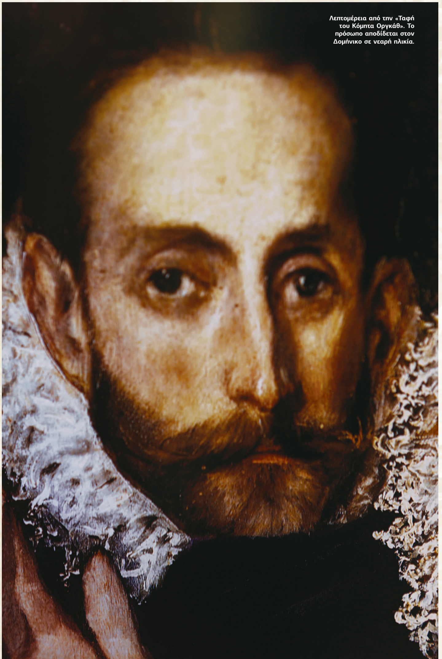
Λεπτομέρεια από την «Ταφή του Κόμπτα Οργκάθ». Το πρόσωπο αποδίδεται στον Δομήνικο σε νεαρή ηλικία.

Αποφεύγει να προσδιορίσει ως τόπο καταγωγής τους Λάκκους, και μιλάει γενικά για διαμέρισμα των Χανίων, διότι θεωρεί ότι αναφέρονται «μέλη της οικογένειας Θεοτοκόπουλου στο Κρουστογέρακο από τον 15ο αιώνα».