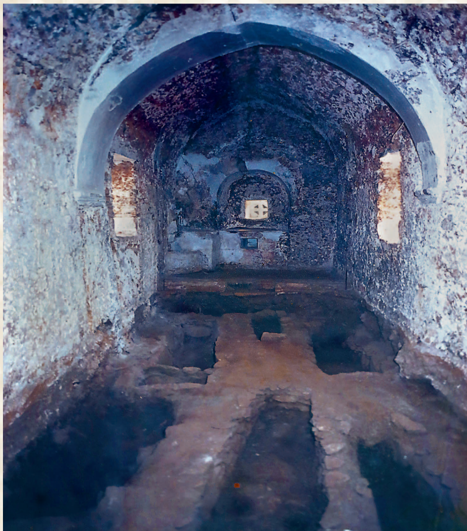
Ενταφιασμοί από ανακομιδές εντός του ναού.

Η άποψη για «πιθανό εμπρησμό» του ναού την περίοδο της Τουρκοκρατίας θα πρέπει να επαναξιολογηθεί. Όταν πραγματοποιήθηκε η ανασκαφή, ήταν σε γνώση μας στοιχεία μόνο για τους εμπρησμούς των Λάκκων από Τούρκους. Σήμερα πρέπει να αξιολογηθούν και να συνεκτιμηθούν τα νεώτερα στοιχεία για «εμπρησμό» και «καταστροφή» των Λάκκων και από τους Ενετούς, όπως αναφέρονται στα επίσημα ενετικά αρχεία και παρουσιάζονται από την κ. Παπαδιά. Σε αυτή την επανεκτίμηση, θα βοηθήσει και η χρονολόγηση της κατασκευής του τέμπλου και των εικόνων του. Χωρίς να είμαι ειδικός, το τέμπλο, αν δεν είναι σύγχρονο της επέκτασης του ναού, δηλαδή του 1580, φαίνε-