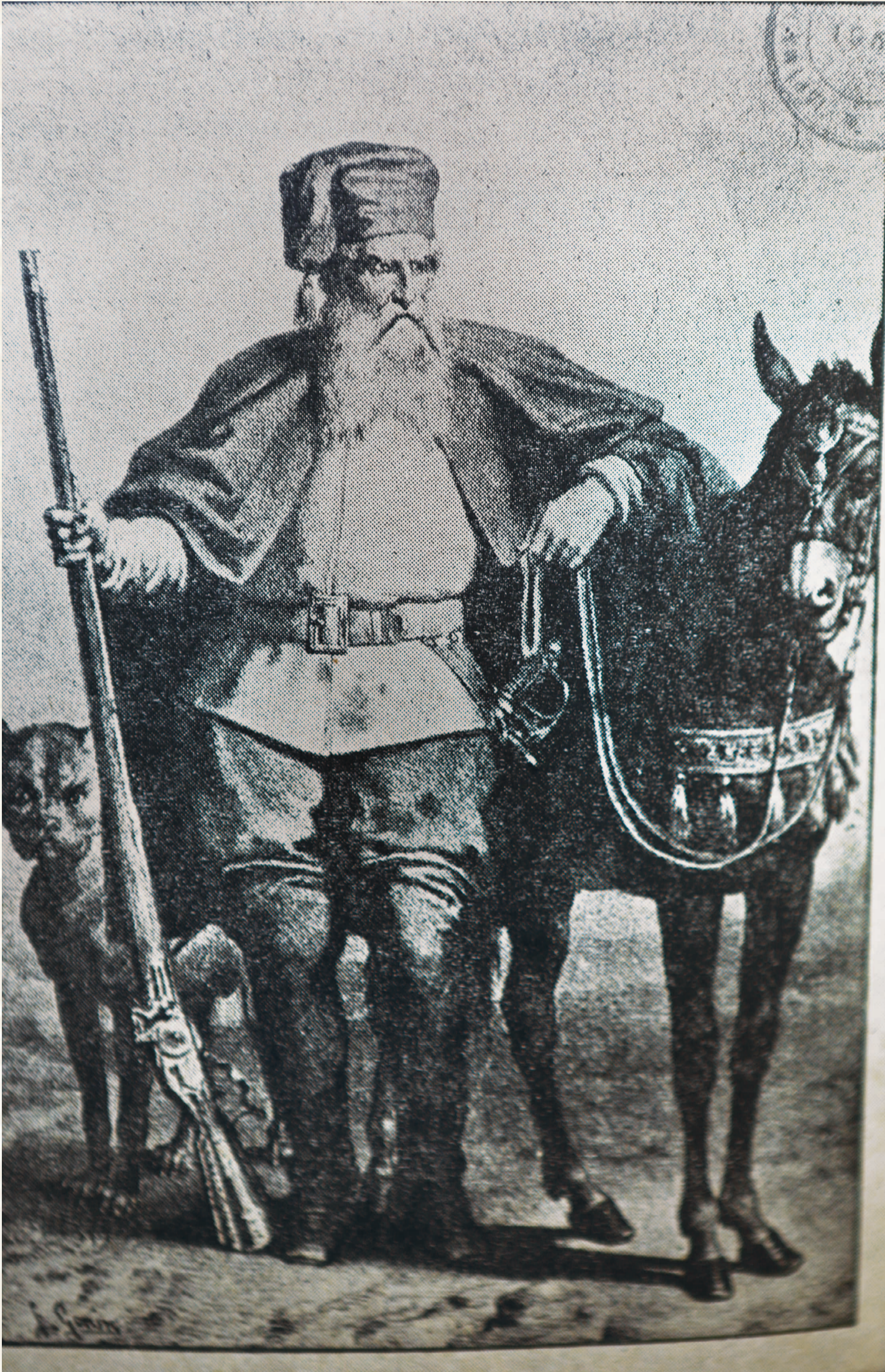
Απεικόνιση της λιθογραφίας του Κανταναλέοντα, όπως αποτυπώνεται στην 1η έκδοση των "Κρητικών Γάμων" στο Τορίνο της Ιταλίας.

μαζόμενο σήμερα Ακρωτήρι, εκεί σώζονται ερείπια μονής, που ονομάζονται από τους ντόπιους «Καθολικό», αλλά δεν υπάρχει ιστορική επιβεβαίωση της ύπαρξης του