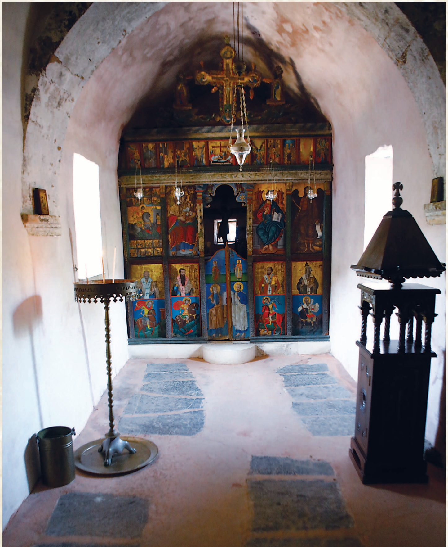
Σημερινή εικόνα του εσωτερικού του ναού, όπου διακρίνονται οι τάφοι και το τέμπλο, μετά την αποκατάσταση.

Ποιοί ήταν αυτοί οι νεκροί και για ποιο λόγο, έπρεπε να «παραβιαστεί» το ελληνορθόδοξο τυπικό της εκκλησίας μας και να ενταφιαστούν εντός του ναού; Ποιες τιμές έπρεπε να αποδοθούν και γιο ποιο λόγο, ώστε να γίνει η ανακομιδή των οστών τους και η εναπόθεση τους σ' αυτό το σεμνό και ιστορικό μνημείο; Όταν μάλιστα απαιτήθηκε για τον ενταφιασμό όλων να ανακατασκευαστεί και να επεκταθεί ο ίδιος ο ναός από την αρχική του μορφή στην σημερινή; Θα τολμήσουμε μερικές υποθέσεις, όπως προκύπτουν από το μνημείο, από την ιστορία του και τα στοιχεία για τα γεγονότα της