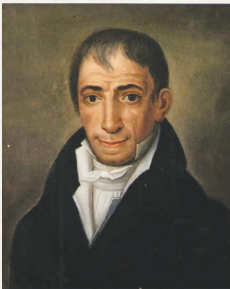
Ο Αδαμάντιος Κοραΐς (1748 - 1833), σημαντική μορφή του ελληνικού στοιχείου στη Γαλλία στο 1 ο μισό του 19ου αιώνα

Στην ελληνική παροικία της Τεργέστης, που είναι και η μεγαλύτερη, συναντούν εμπόδια και παρακολουθούν στενά από την αυστριακή μυστική αστυνομία, ενώ μερικοί μεγαλύτεροι έχουν μνηθεί από τα