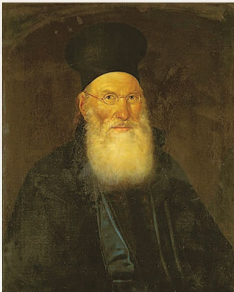
Σημαντικές προσπάθειες ως «δημοσιογράφος» και ως έφορος Παιδείας κατέβαλε τα πρώτα χρόνια της Επανάστασης ο Θεόκλητος Φαρμακίδης

Ένα χρόνο αργότερα, η 2η εθνοσυνέλευση (Αστρος, 1823) θεσπίζει την αλληλοδιδασκτική μέθοδο και κάνει λόγο επίσημα για οργάνωση εκπαίδευσης, στο άρθρο 87 του συντάγματος. Τότε, βάσει των συνταγματικών διατάξεων, και η δημόσια εκπαίδευση τέθηκε υπό την προστασία του Βουλευτικού Σώματος και ιδρύθηκε, από 29/2/1824 (δάσκαλοι οι Ιω. Ειρηναίος και Δ. Σουρμελής), δημόσιο σχολείο ελληνικών και ιταλικών στην Αθήνα, όπου το φθινόπωρο του ίδιου χρόνου, από δημοσιεύματα του Τύπου (2/10/1824 – «Ελληνικά Χρονικά»), αναζητούνται από τη Φιλόμουσο Εταιρεία Αθηνών δάσκαλοι για να ιδρυθεί αλληλοδιδασκτικό σχολή. Ένα έτος, όμως, νωρίτερα, στις 5/7/1823, ο Θεόκλητος Φαρμακίδης (1784