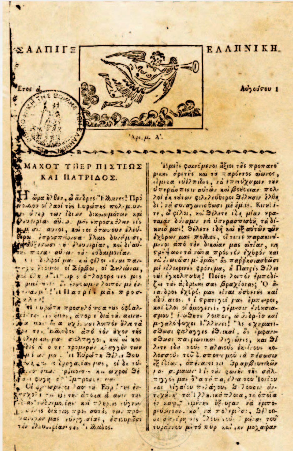
«Σάλπιγξ Ελληνική», από τις πρώτες επαναστατικές εφημερίδες

Η διασημότερη, όμως, εφημερίδα του Αγώνα ήταν τα «Ελληνικά Χρονικά». Η έκδοση και η επιτυχία της οφείλεται, πρώτα –