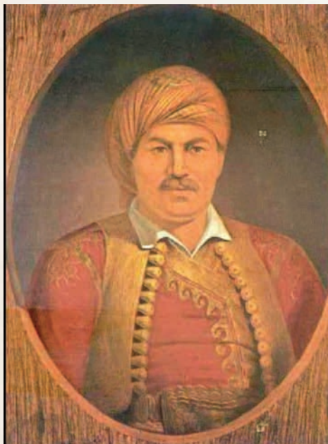
Προσωπογραφία του Χατζημιάλη Νταλιάνη

Το 1824 – 1825, λοιπόν, η ομάδα αυτή των Κυπρίων εργαζόταν για να πείσει την ελληνική κυβέρνηση να στρέψει την προσοχή και τις προσπάθειές της και στην