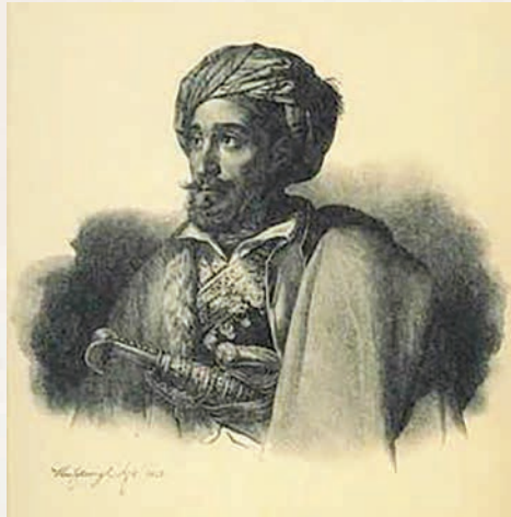
Γλαφυρός και ελικρινής ο Μακρυγιάννης καταγράφει την Επανάσταση του 1821 στα «Απομνημονεύματά» του.

Από τα απομνημονεύματα που έχουν πολλές και χρήσιμες πληροφορίες για το διαχρονικό αναγνώστη τους και το λιγό-